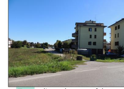
Accesso privato ad alcune abitazioni