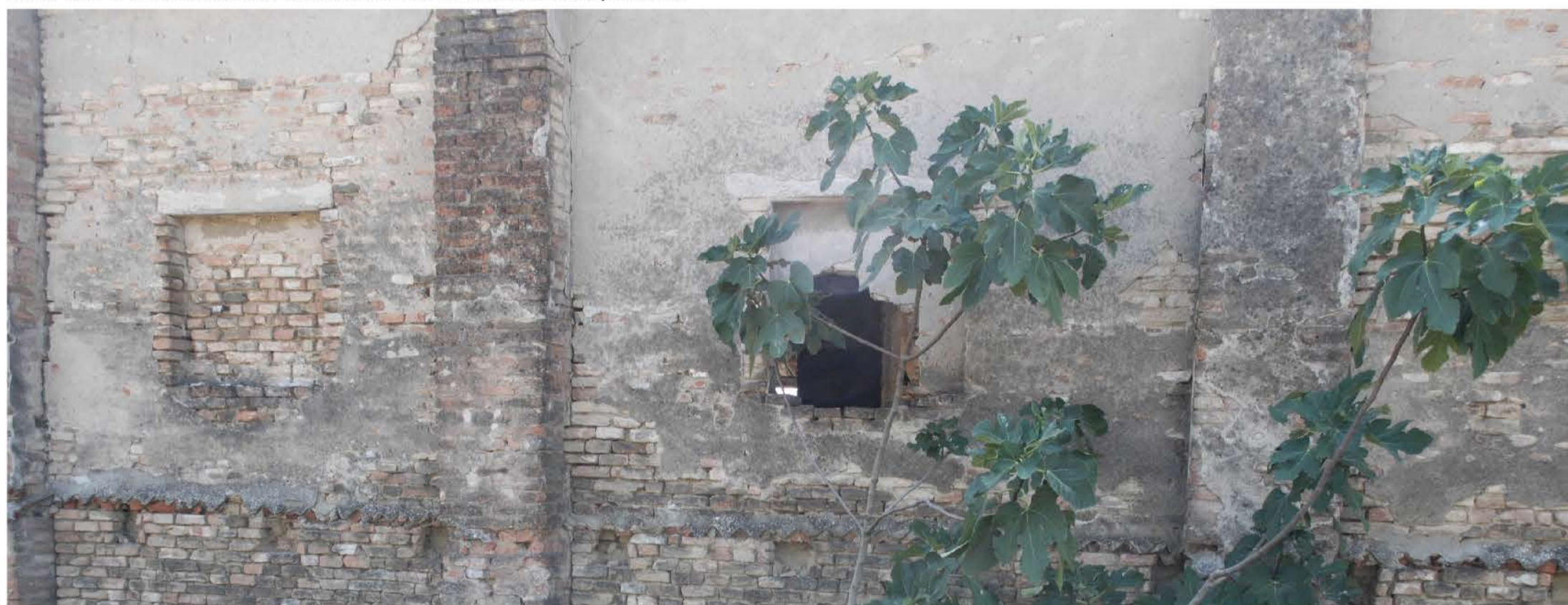
Vista lato N-O _ cedimento del tamponamento