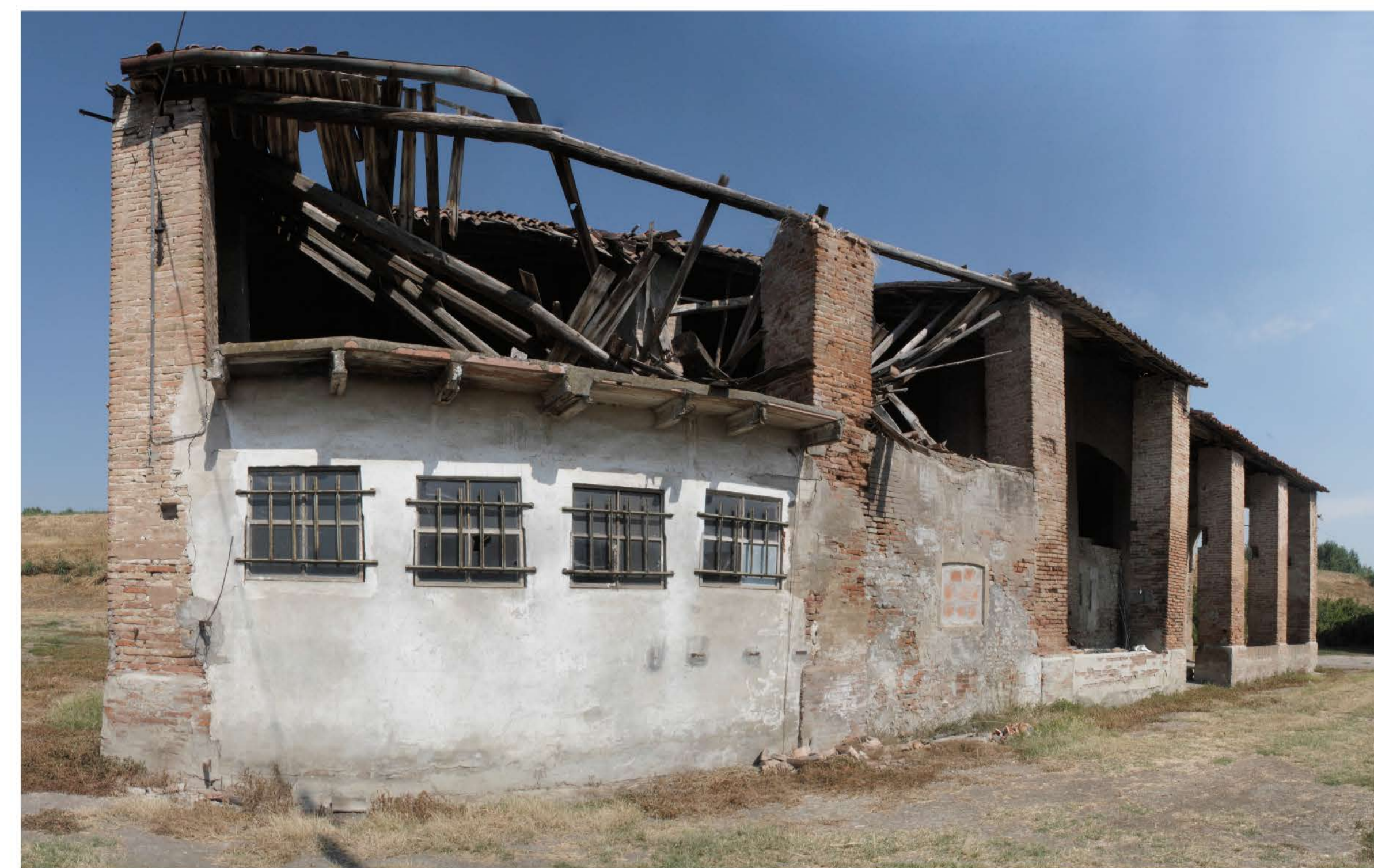
Vista d'insieme _ cedimento del tetto