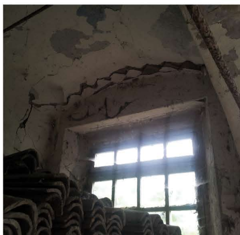
Vista piano terra _ Lesioni all'entradosso degli archi