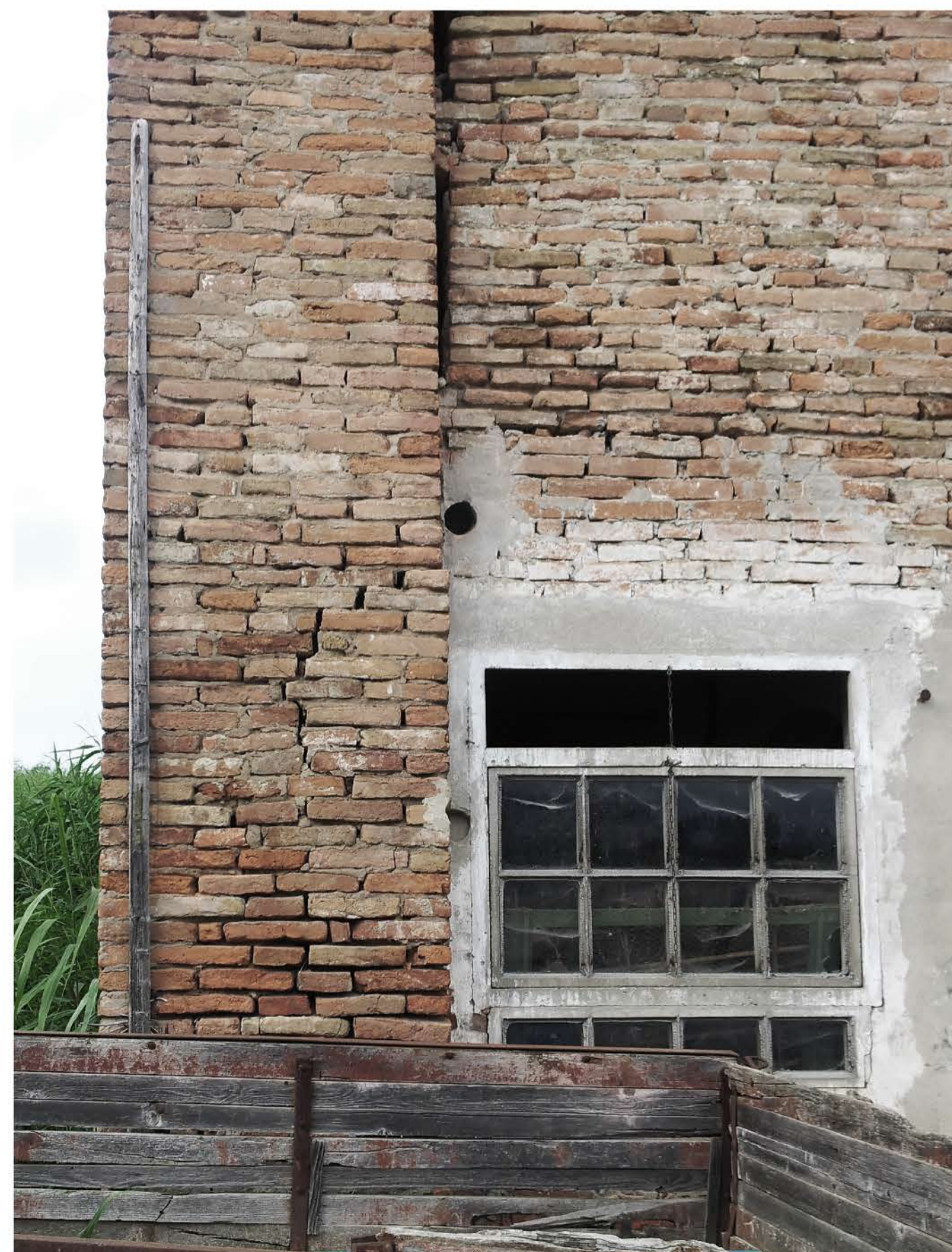
Visata prospetto S-O _ sconnesione della muratura