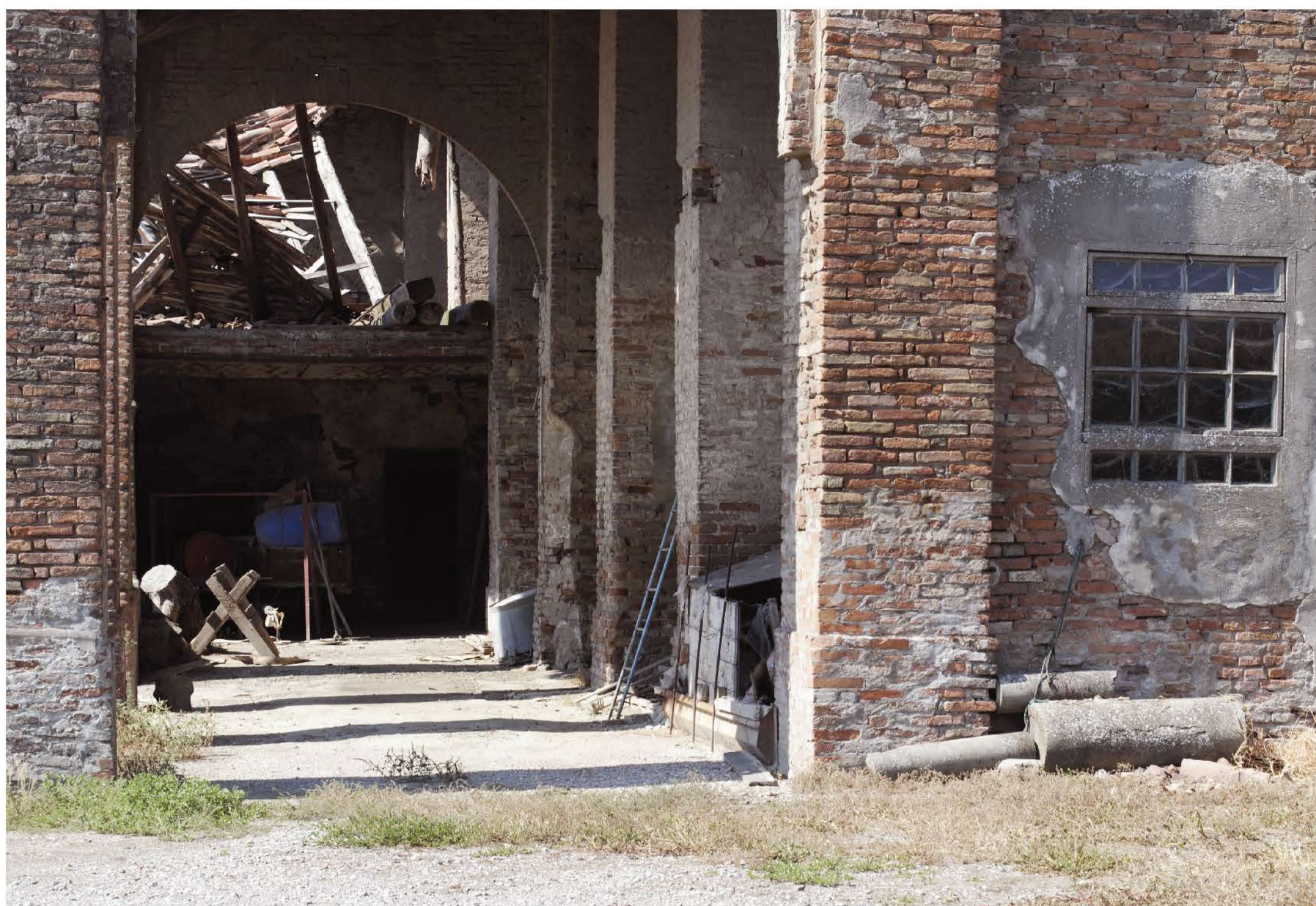
Vista lato N-E _ cedimento del tetto e lesioni alla struttura portante