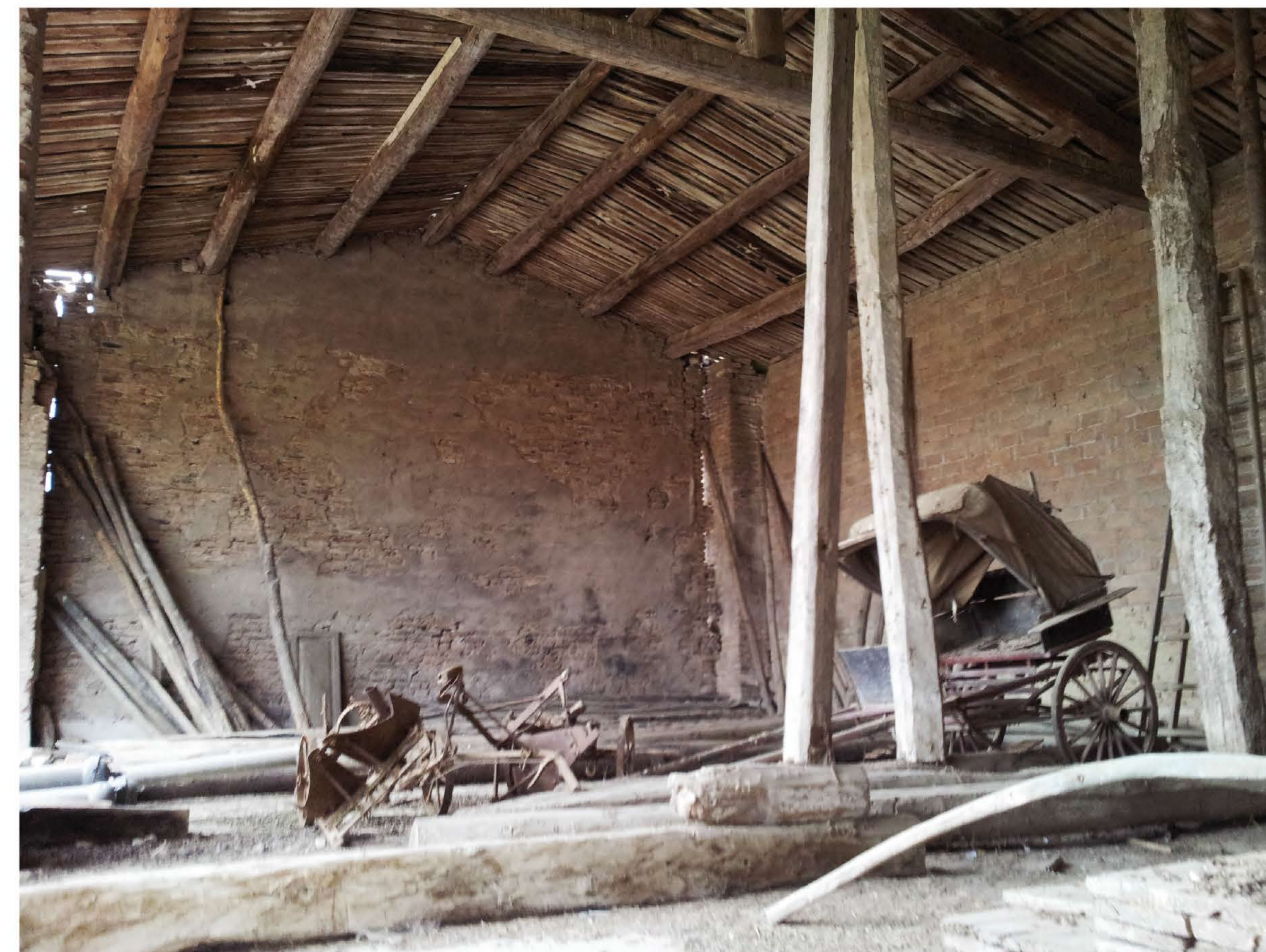
Vista primo piano parete lato S-O _ distacco della muratura di tamponamento dalla struttura portante