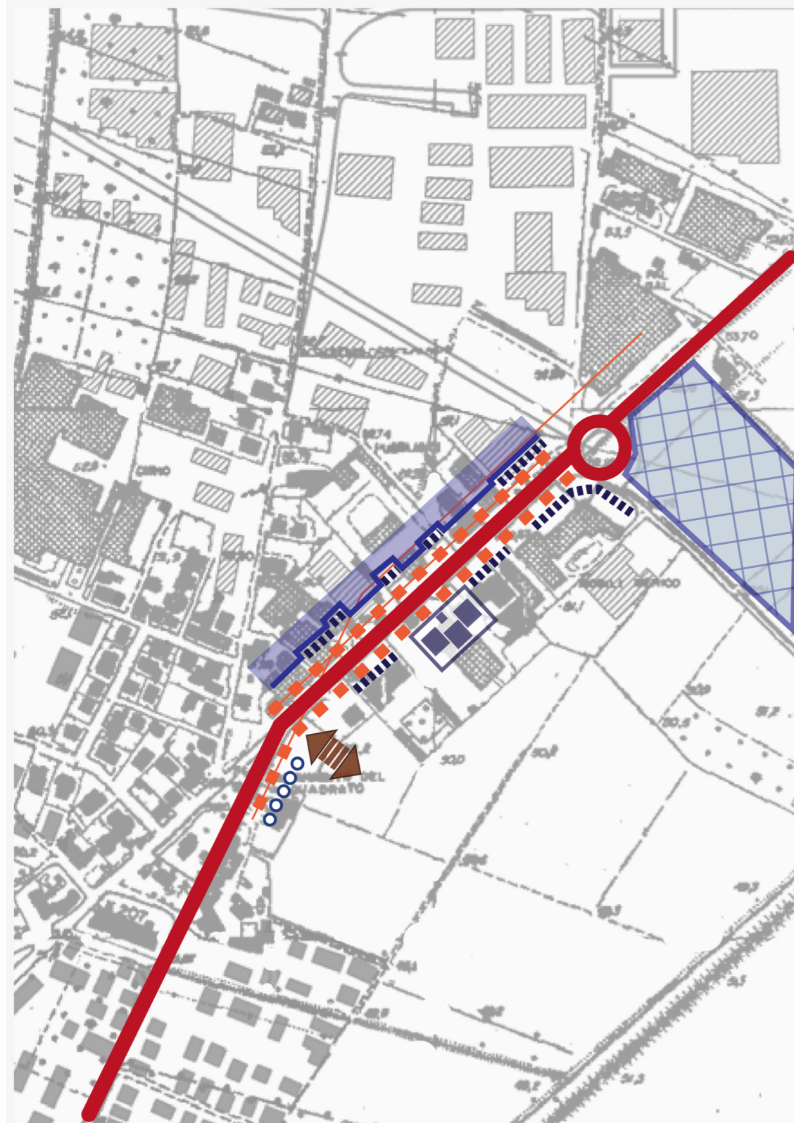
Villafranca, zona industriale ????????????????