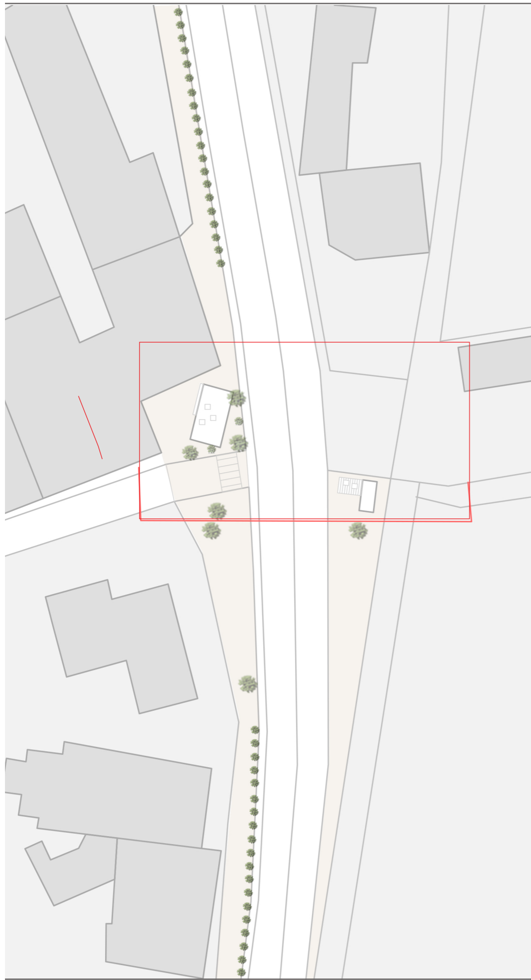
PLANIMETRIA DEGLI SPAZI DI INTERVENTO