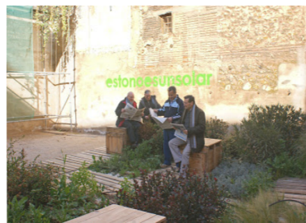
Ridisegno degli spazi pubblici. Saragozza e Sidney (Airia)