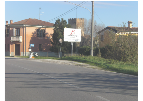
Gli spazi della "pesa" ed il rapporto con l'infrastruttura