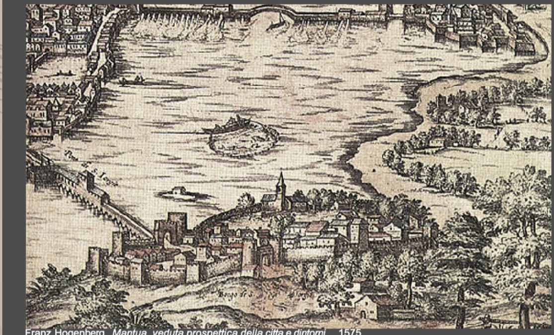
Franz Hogenberg, Mantua, veduta prospettica della città e dintorni , 1575.