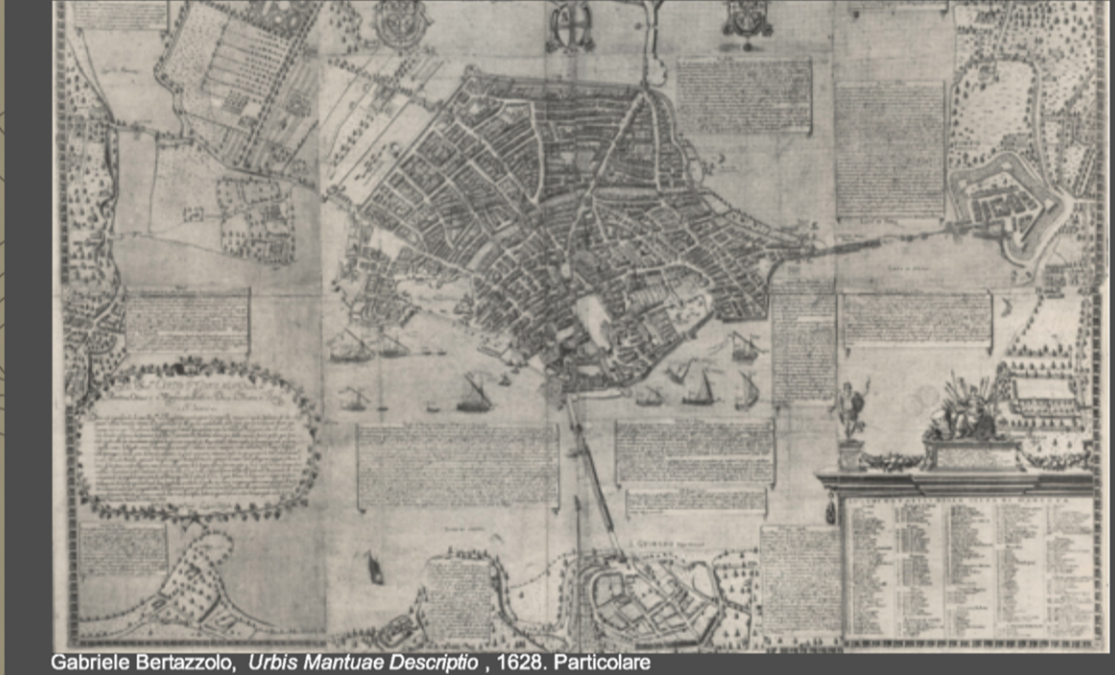
Gabriele Berzuzzolo, Urbis Mantuae Descriptio , 1628. Particolare