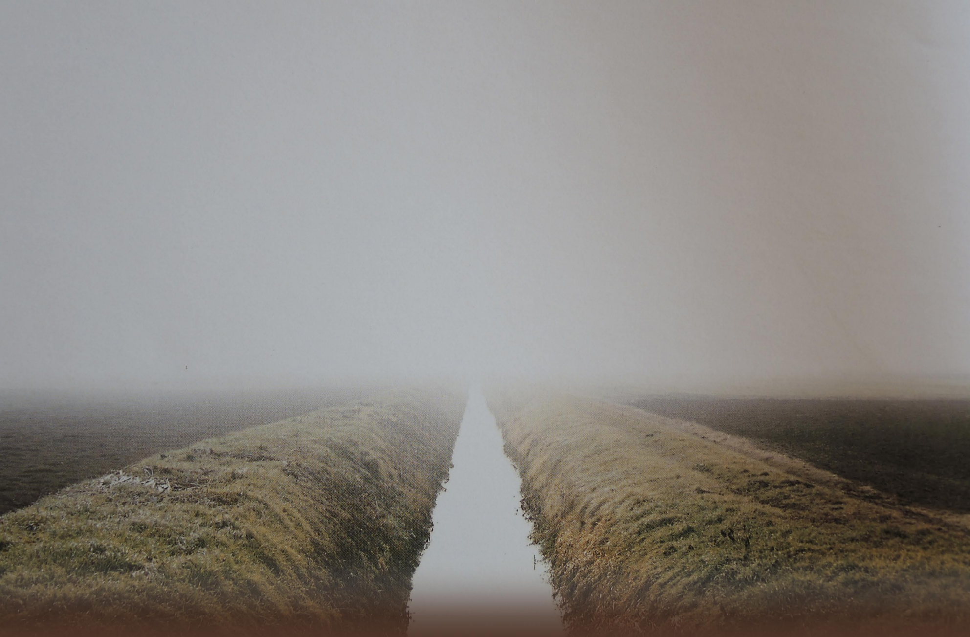
EMILIA, I CAMPI COLTIVATI