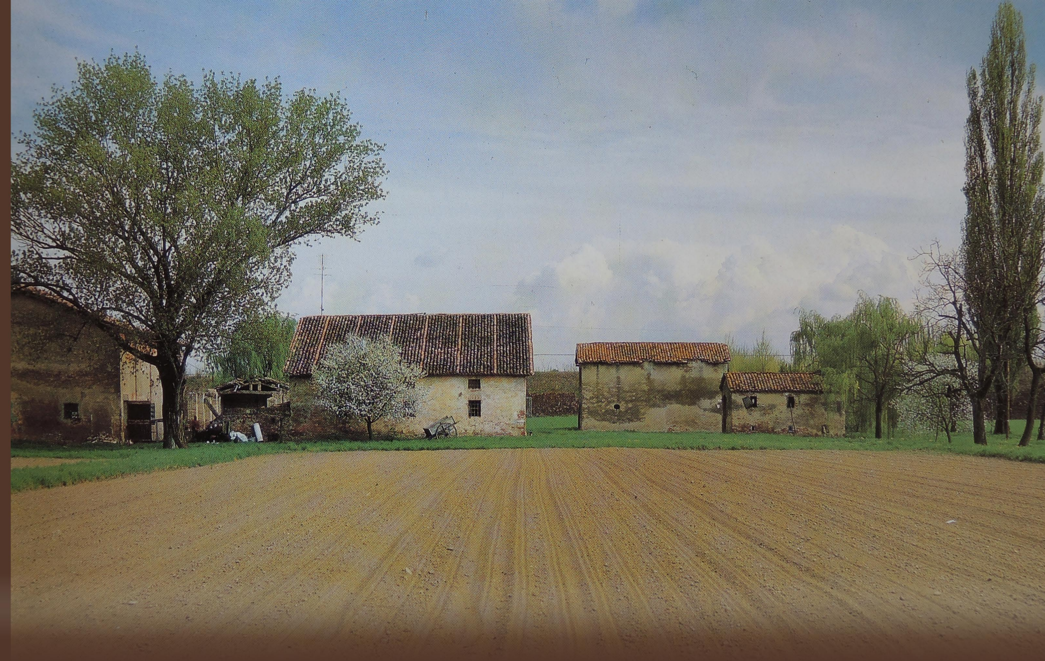
EMILIA, LE CASE RURALI