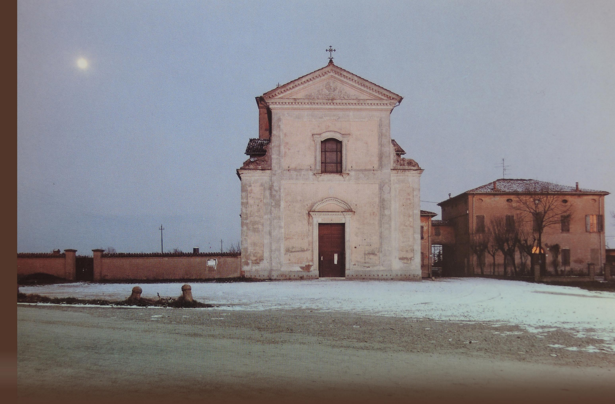
EMILIA, IL PAESE