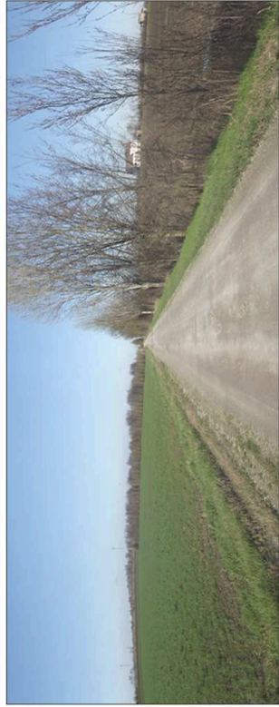
1. Valli di Novellara e Reggolo: ambito di tutela ambientale