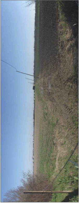
7. Campi ad uso agricolo