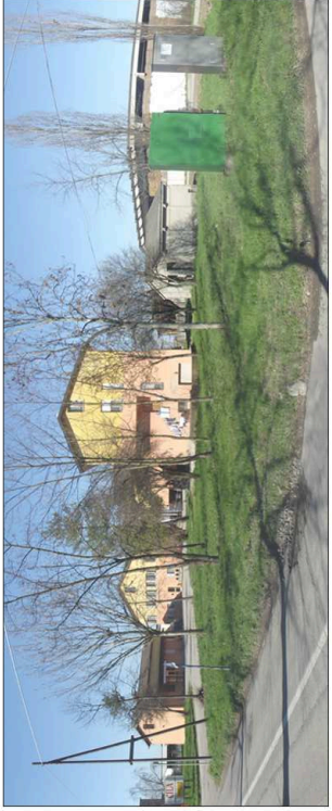
10. Consorzio C.I.L.A.