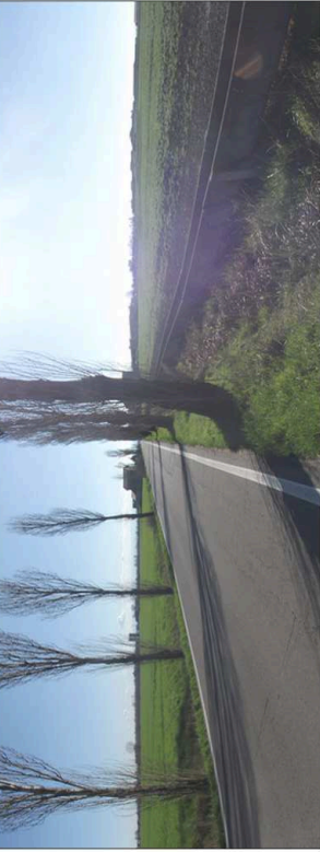
8. Strada della Vittoria