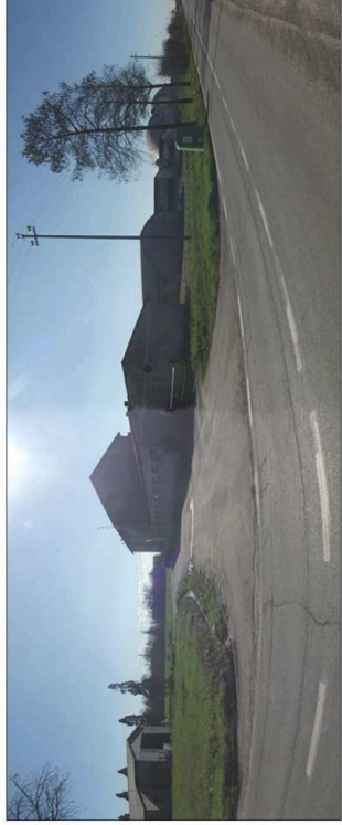
12. Fabbricati ad uso stalla