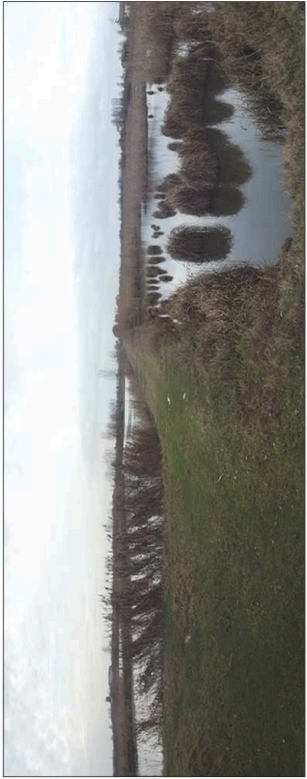
5. Badini di coltivazione del riso