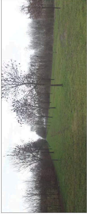
13. Filari di alberature