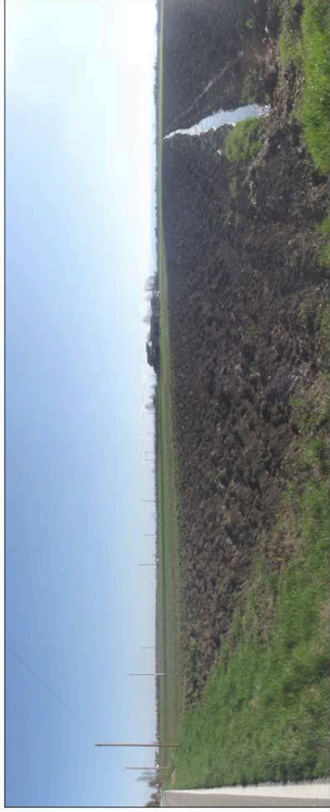
15. Ambito agricolo posto nelle vicinanze della discarica