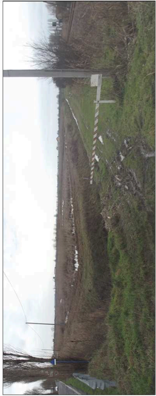
3. Scordo delle risale e della linea ferroviaria dalla strada SP 42