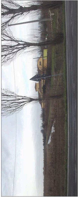
4. Scordo da Via della Vittoria verso la SP 42