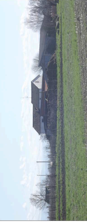
14. Cascina rurale