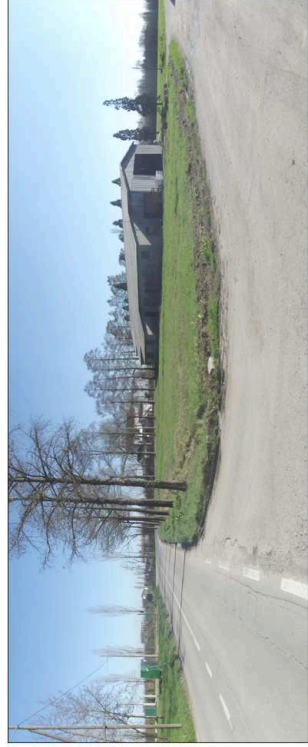
11. Edificio adibito a magazzino e ricovero attrezzi