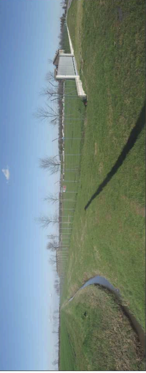
16. Vista della zona di deposito cassonetti interna alla discarica