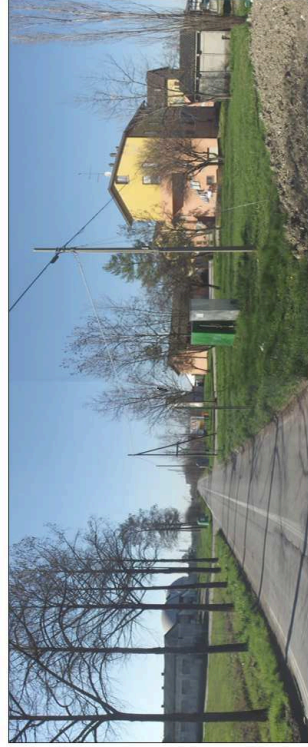
9. Via Levata e Consorzio C.I.L.A.