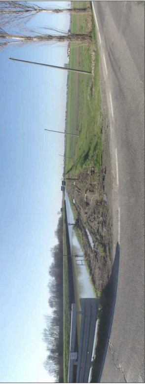
6. Canale di bonifica