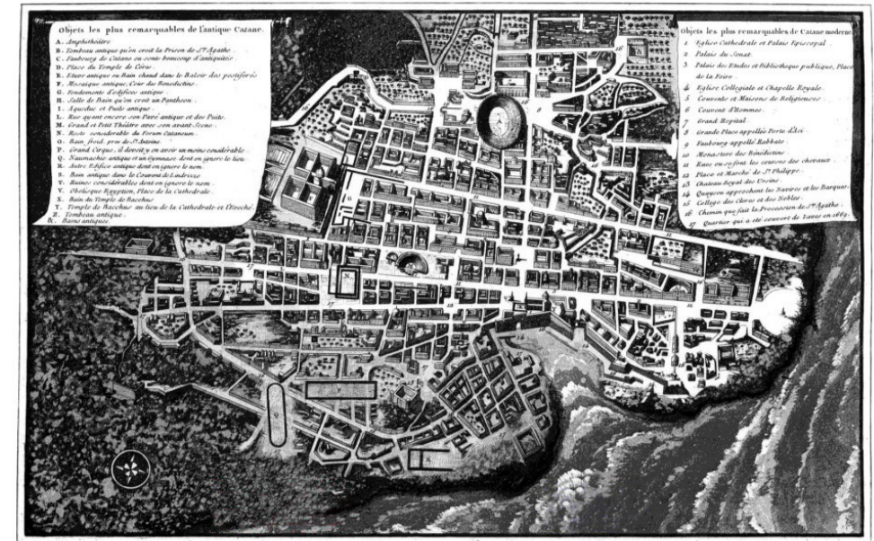
pianta del XVII sec.