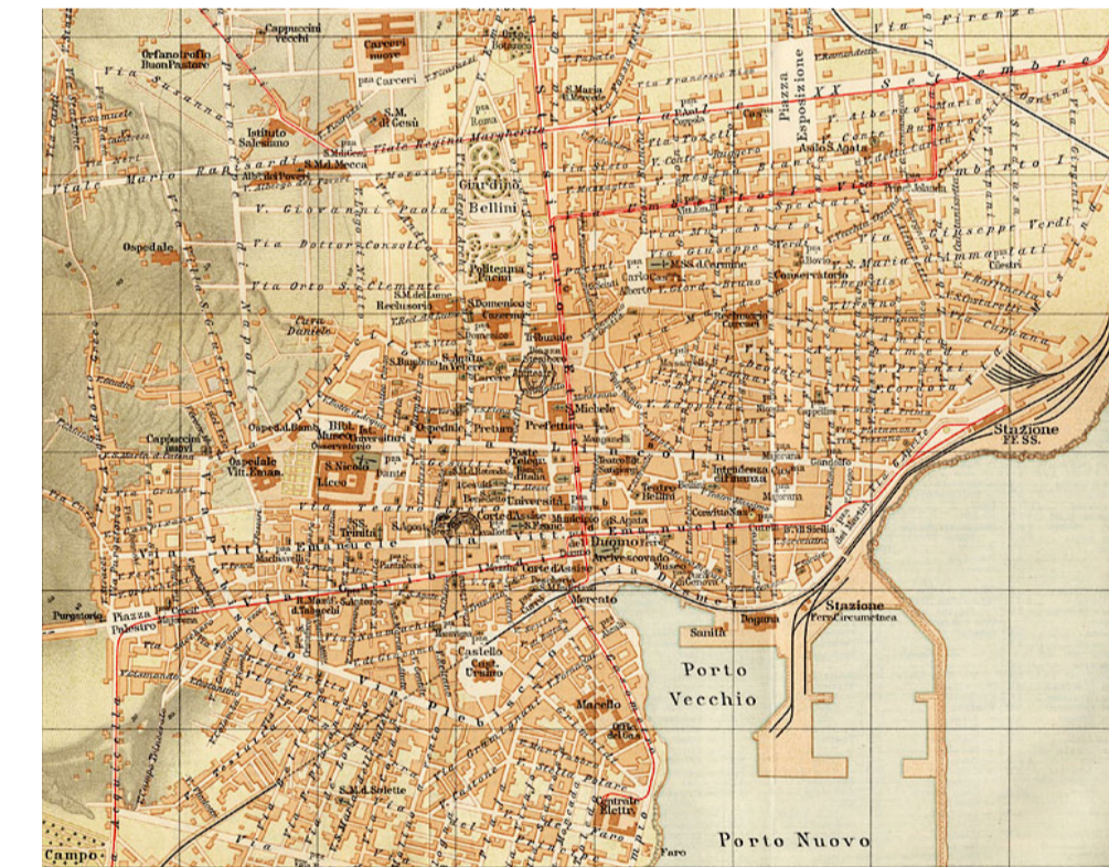
Carta di Catania, 1919

Politecnico di Milano Facoltà di Architettura Anno accademico 2012/13