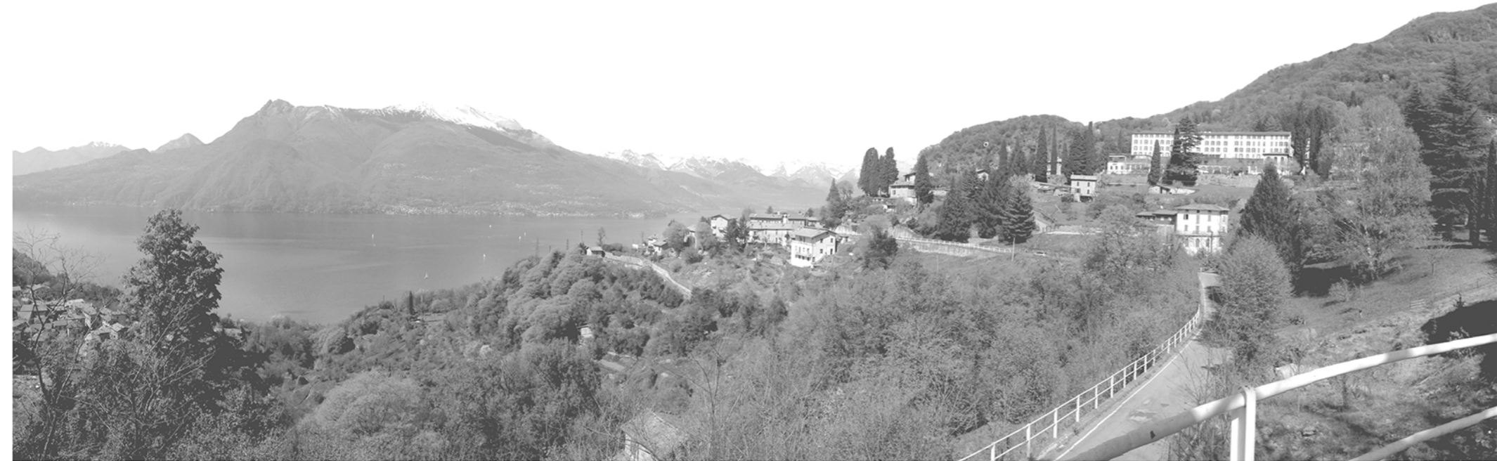
STAZIONE DI PARTENZA