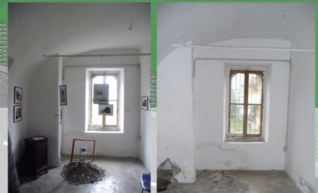
FOTO 2 - IL LOCALE PER IL PRESTITO/DEPOSITO DEI VOLUMI Una volta raggiunto il livello 4 dall'interno del chiostro si può accedere agli spazi biblioteca attraverso il locale prestito/deposito volumi. La biblioteca è raggiungibile anche direttamente da via Gattamelata senza entrare nel chiostro (vedi modello 3d).