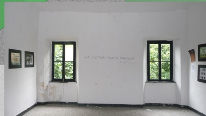
FOTO 4 - L'AULA STUDIO Dagli spazi della biblioteca si accede all'aula studio dotata di tavoli e postazioni pc per le ricerche. La sua superficie è di 38 mq. Da qui è possibile uscire direttamente sul loggiato che si trova alla medesima quota dei locali suddetti.