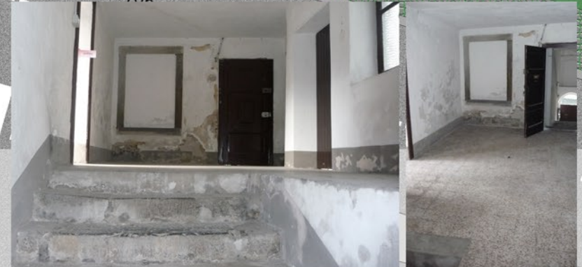
FOTO 1 - LO SBARCO DELL'ASCENSORE Lo sbarco dell'ascensore posizionato sul lato nord del chiostro è il medesimo di quello delle scale esistenti che costituivano l'unico collegamento verticale tra il livello 3 e 4. Questo permetterà a un'utenza diversamente abile di raggiungere la quota del loggiato. La porta nella foto è l'accesso all'area della biblioteca mentre a sinistra vi è l'accesso alla loggia.