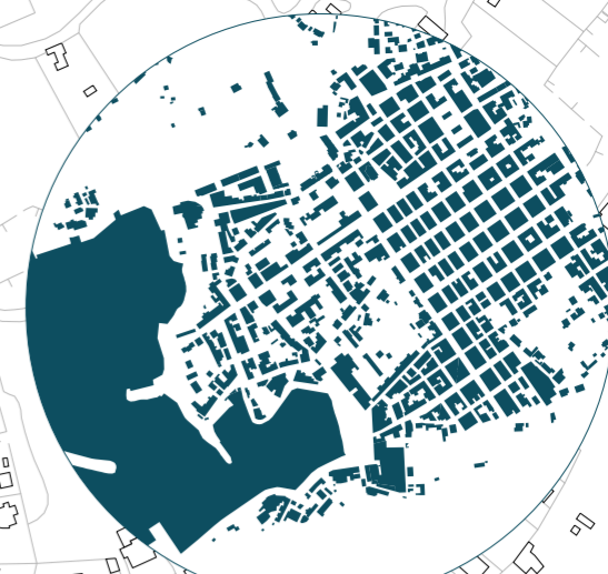
Oggi - 2014