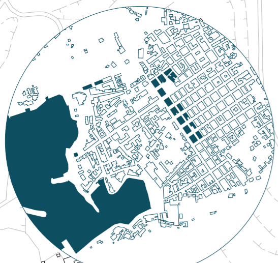
Regno Borbonico - 1854