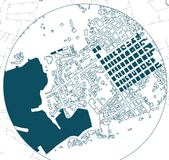
Il Dopoguerra - 1950