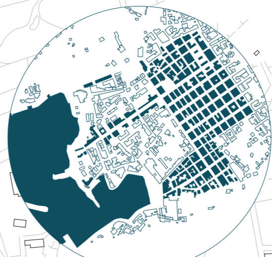
Boom Turistico - 1970