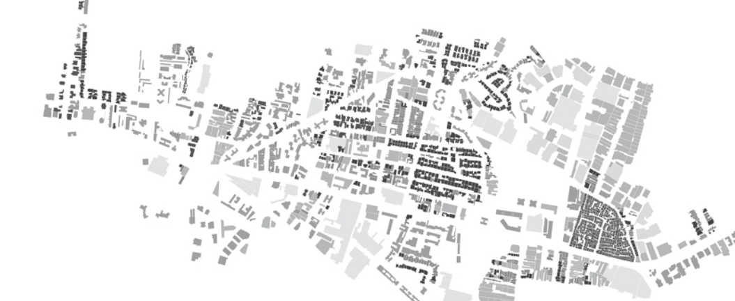
Grana del costruito