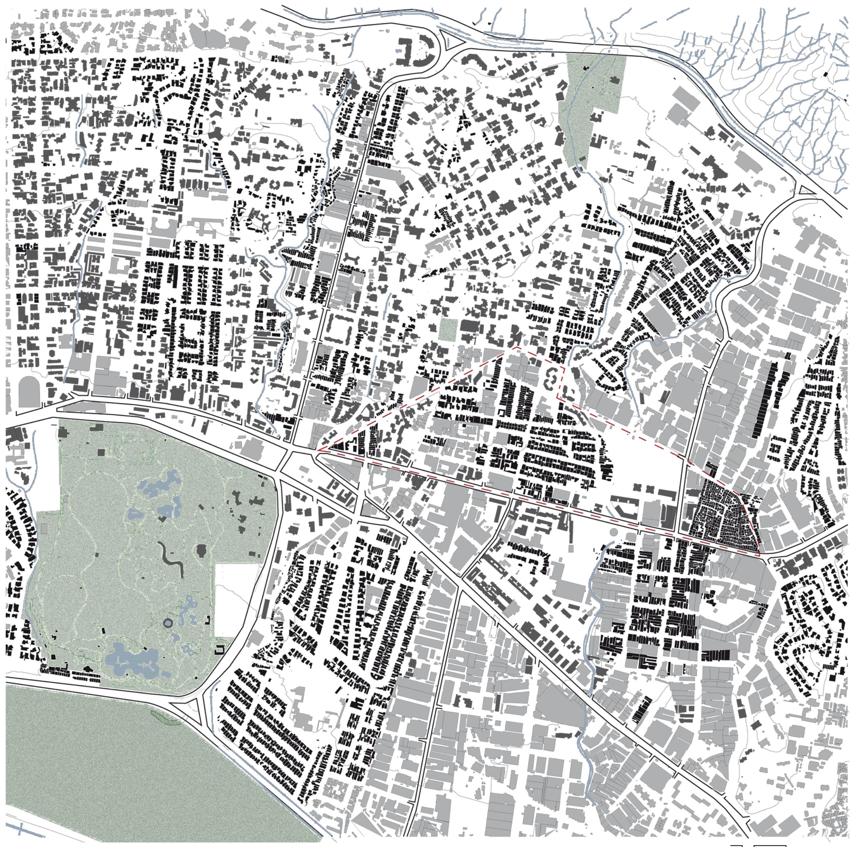
Inquadramento morfologico dell'area di Montecristo e Boileta e rapporto assi portanti e sistemi di spazi aperti