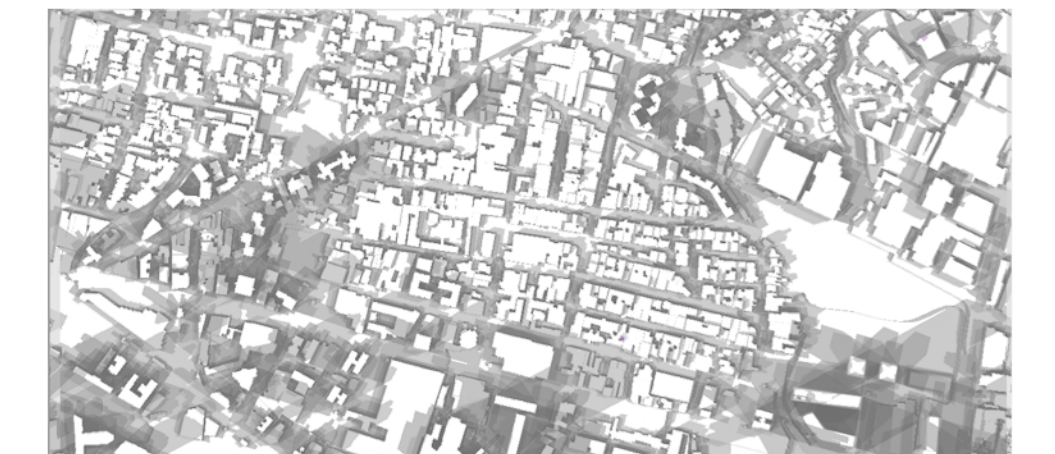
Incidenza solare Schema delle ombre prodotte nei mesi di Gennaio e Luglio alle ore 09,00, 11,00, 13,00, 15,00 e 17,00