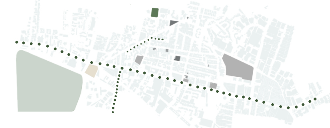
Spazi aperti disegnati e labilità ■ Vuoti residuali ■ Stato di abbandono ■ Magazzini commerciali