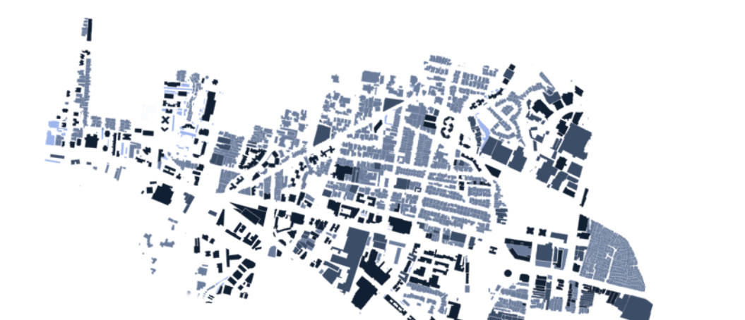
Altezza del costruito ■ +12 m ■ 9-12m ■ 6-8 m ■ 3-5 m