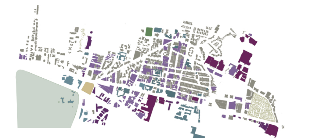
Destinazioni funzionali ■ Residenza ■ Ufficio ■ Cultura/Religione ■ Inseadimenti Informali ■ Industria ■ Piazza ■ Educativo ■ Parco