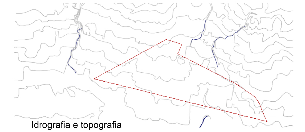
Idrografia e topografia