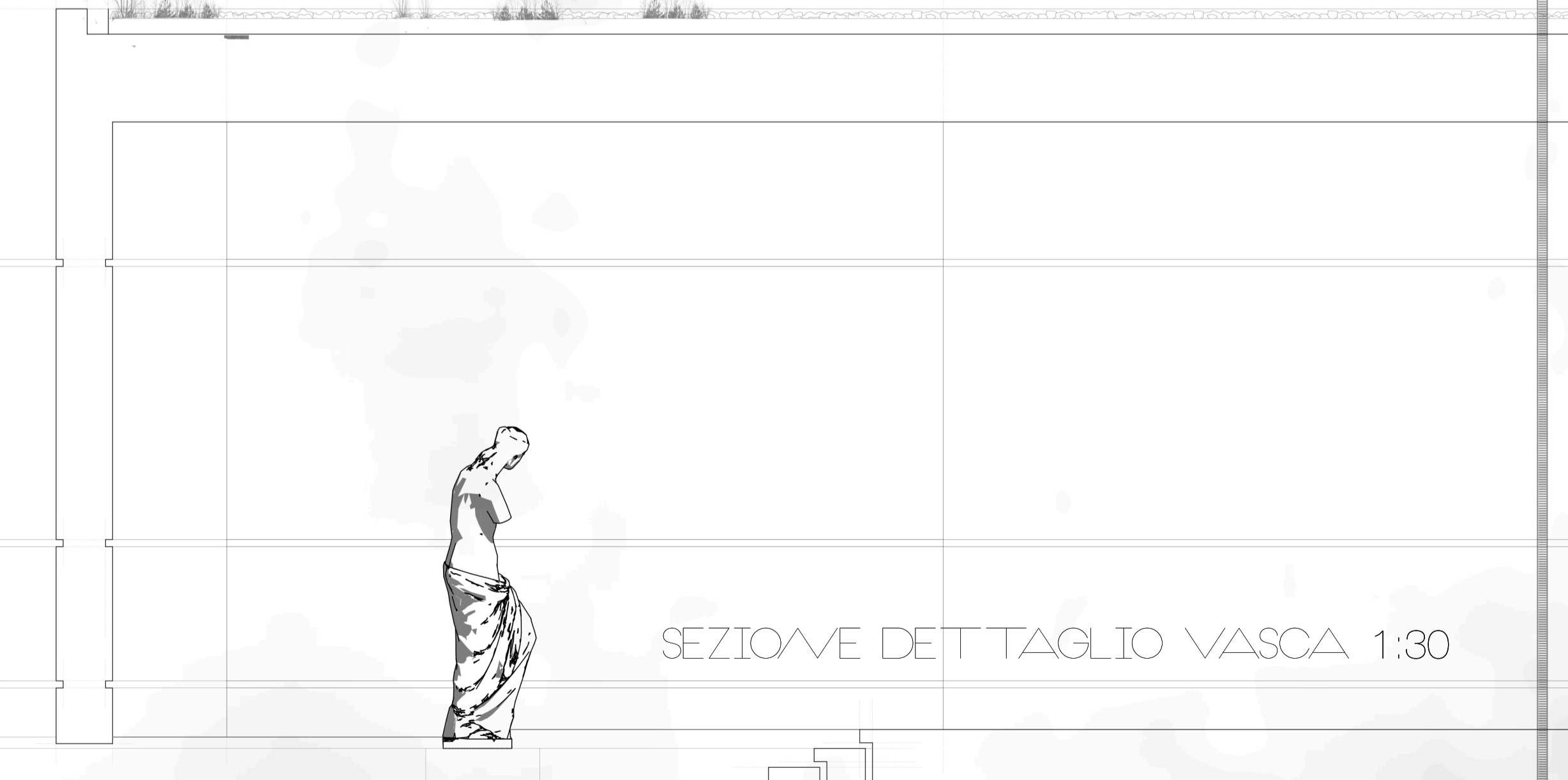
SEZIONE DETTAGLIO VASCA 1:30

PROGETTO IL CORTILE RICAVATO, VA A DEFINIRE UNO SPAZIO NEVRALGICO IN CUI LA TENSIONE DELLA ROTAZIONE E' BILANCIATA DALL'INERZIA DEI BRACCI CHE COSTITUISCONO I PADIGLIONI. L'EMERGERE DELLA MASSA MURARIA CURVILINEA RISPETTO ALLA QUOTA DEI SETTI INTERCETTATI, RIMARCA LA FIGURA GEOMETRICA CHE LO GENERA. IL CERCHIO E' ANCHE L'ELEMENTO CHE UNISCE LE VARIE PARTI,