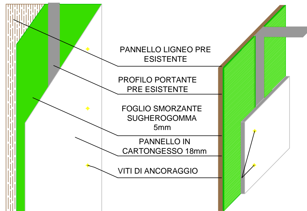
Parte verticale della soluzione