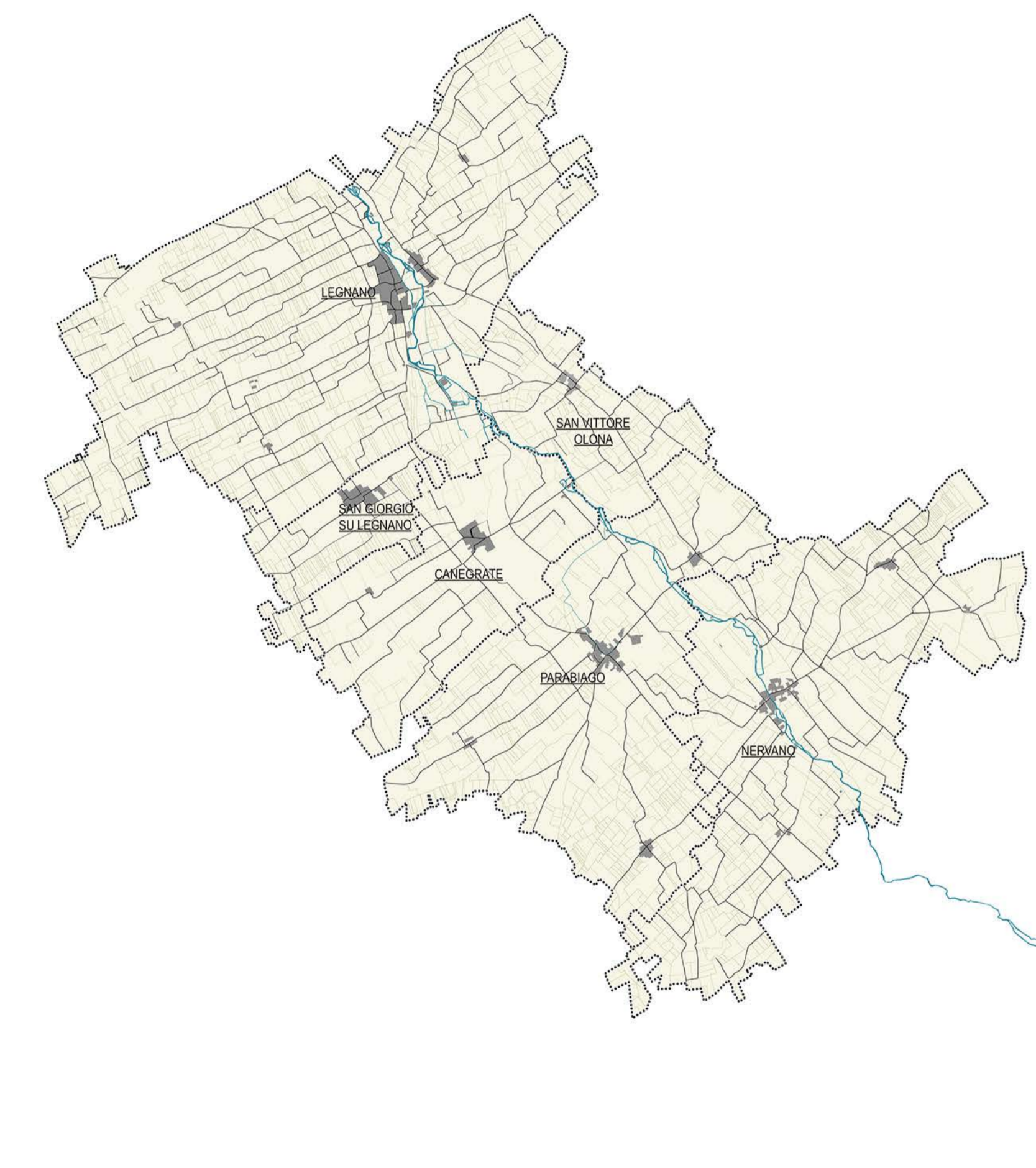
1856 - 1873 _ CATASTO LOMBARDO VENETO