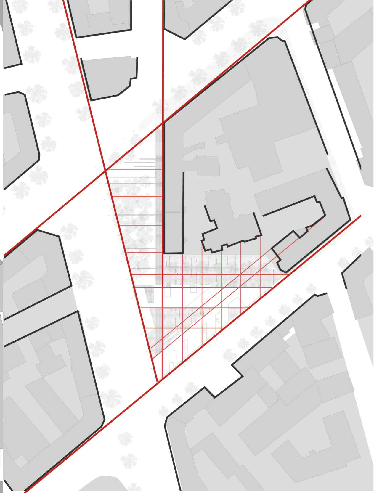
ritmi e allineamenti

il passo della maglia strutturale e la disposizione del nuovo edificato seguono rispettivamente i ritmi e gli allineamenti derivanti dal costruito esistente e penetranti nel lotto di progetto.