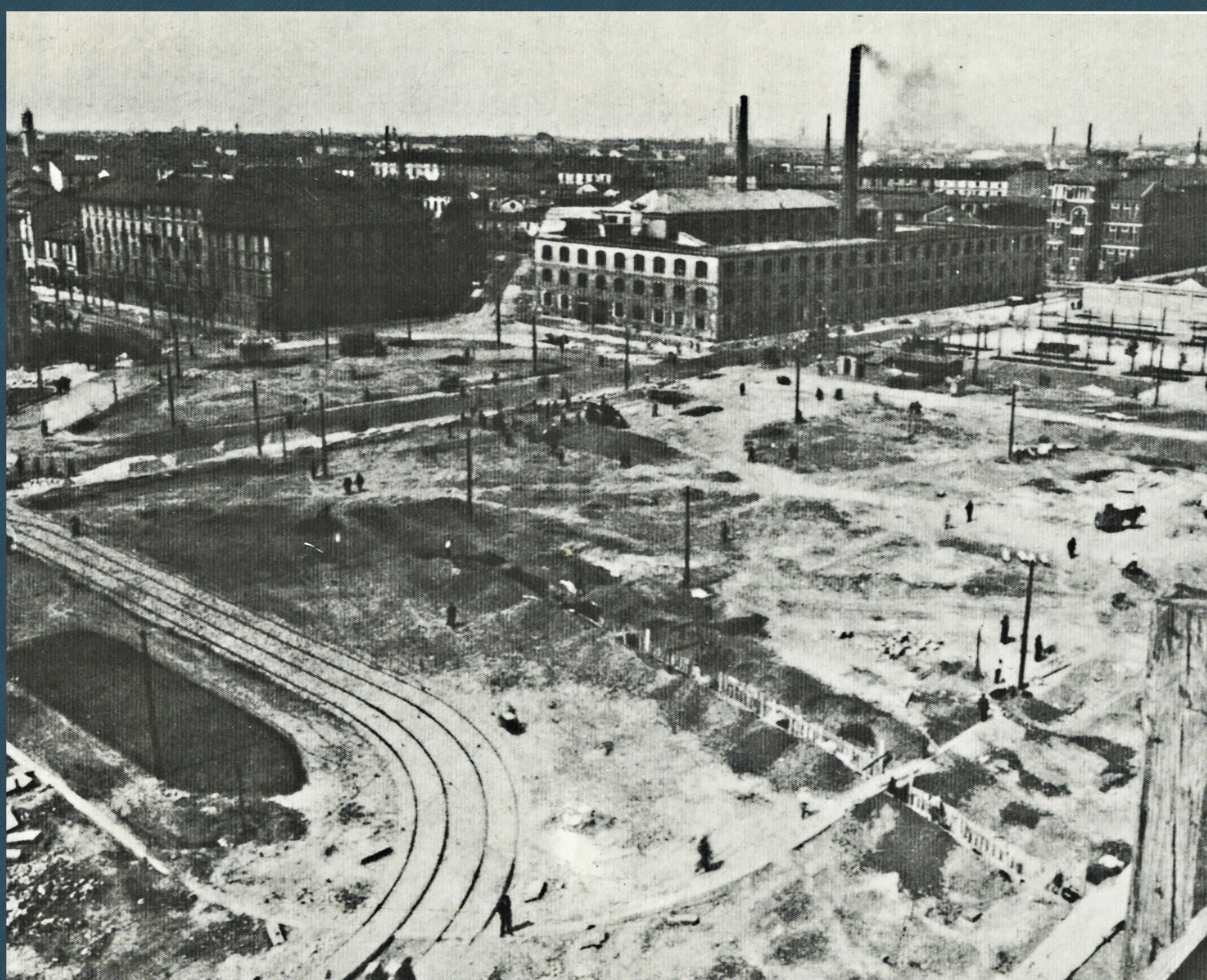
Veduta della Piazza Doria con gli stabilimenti Pirelli e le Scuole di Via Galvani, anni '20