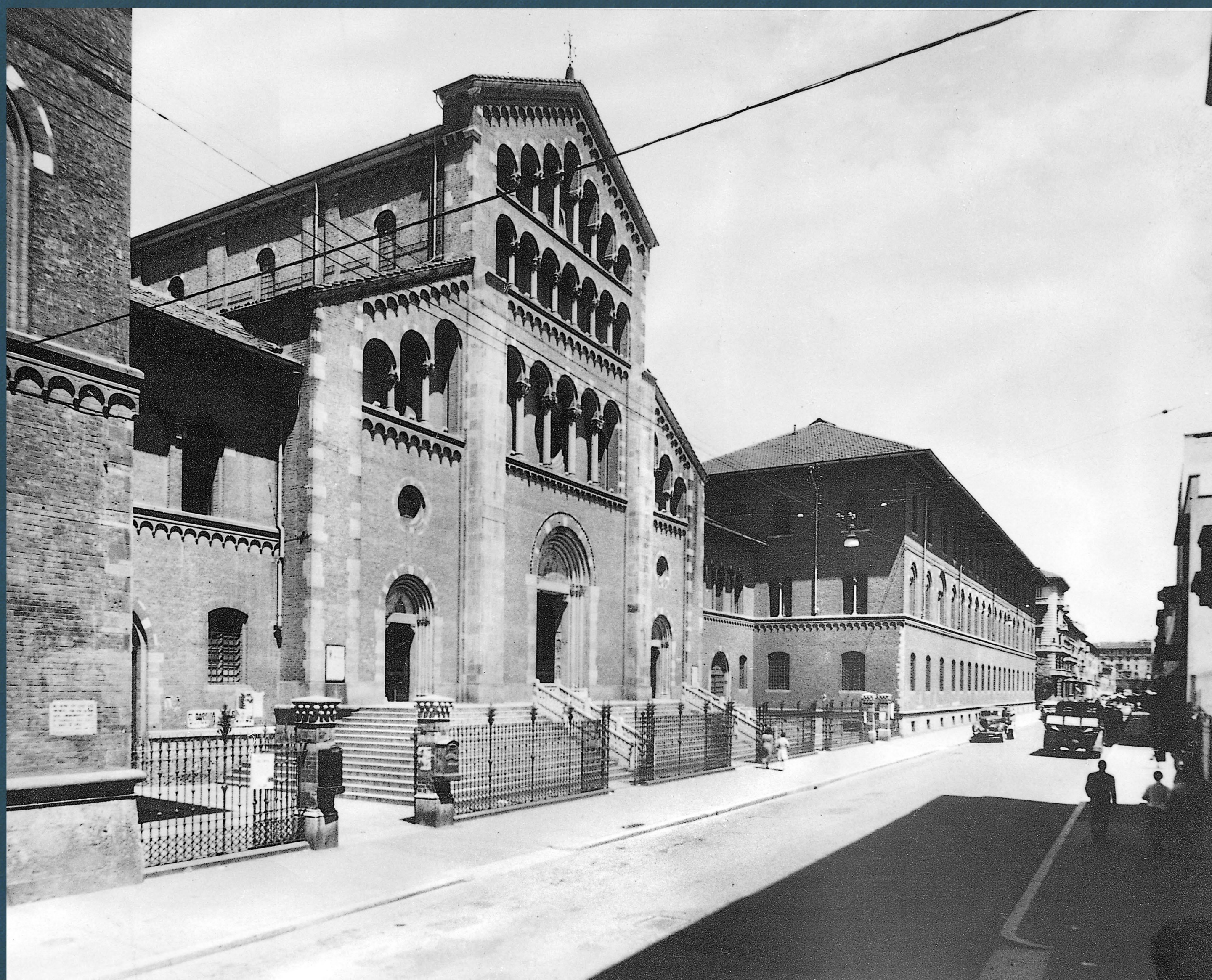
Foto storica della Cittadella dei Salesiani vista da Via Copernico