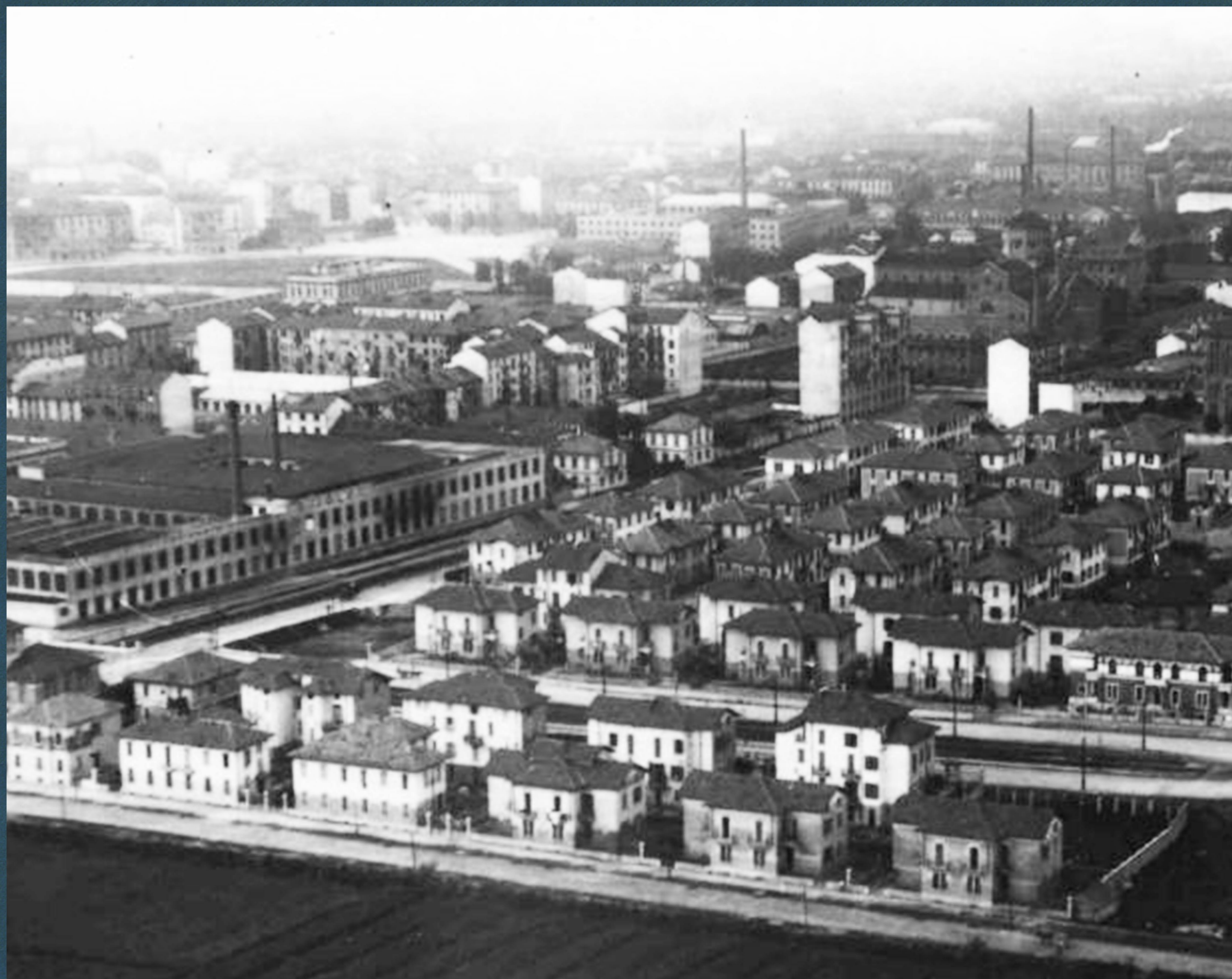
Foto del Villaggio dei Ferrovieri con le Stigler e sullo sfondo la Chiesa di Sant'Agostino