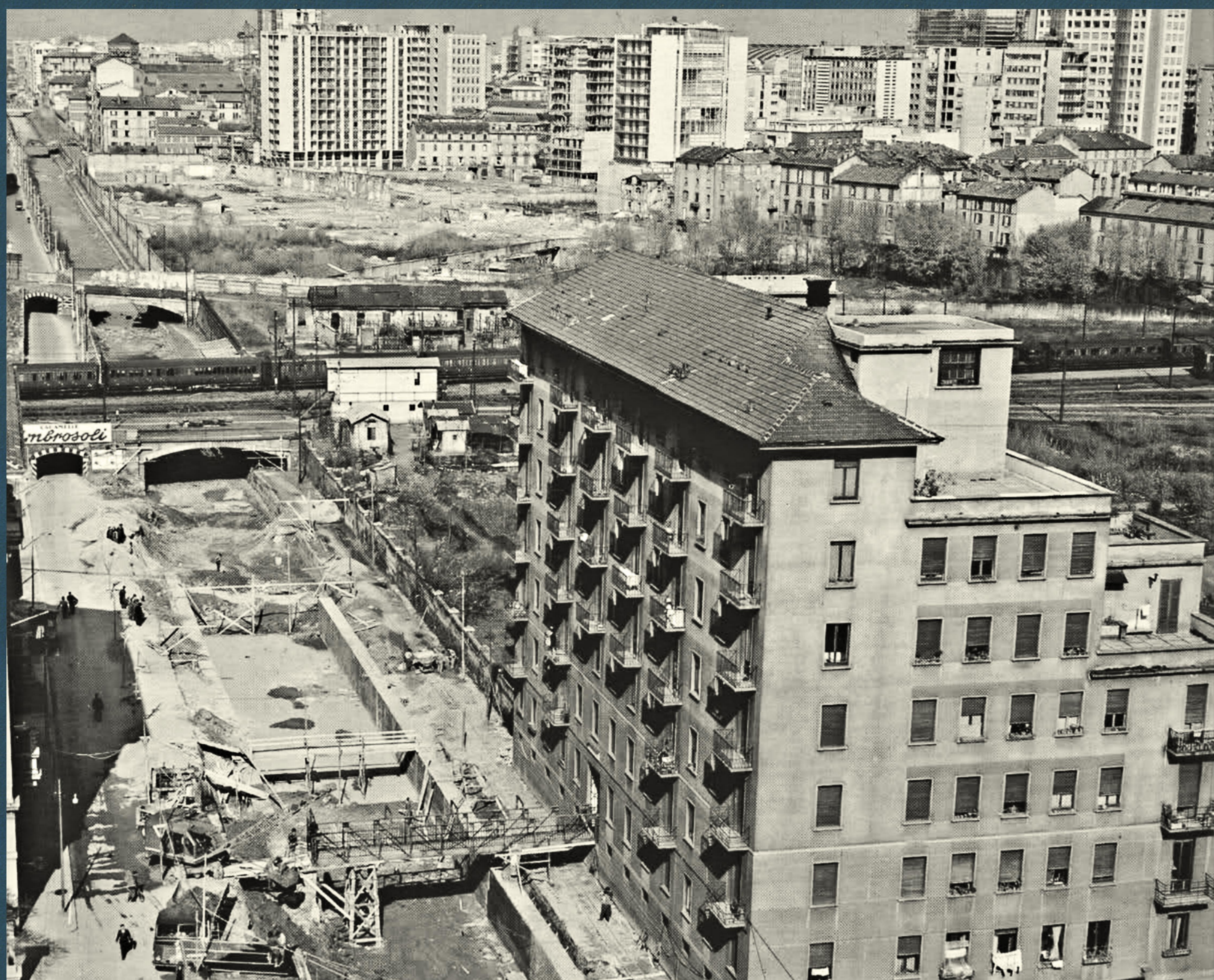
Tombinatura del Naviglio Martesana lungo via Melchiorre Gioia, 1959-60