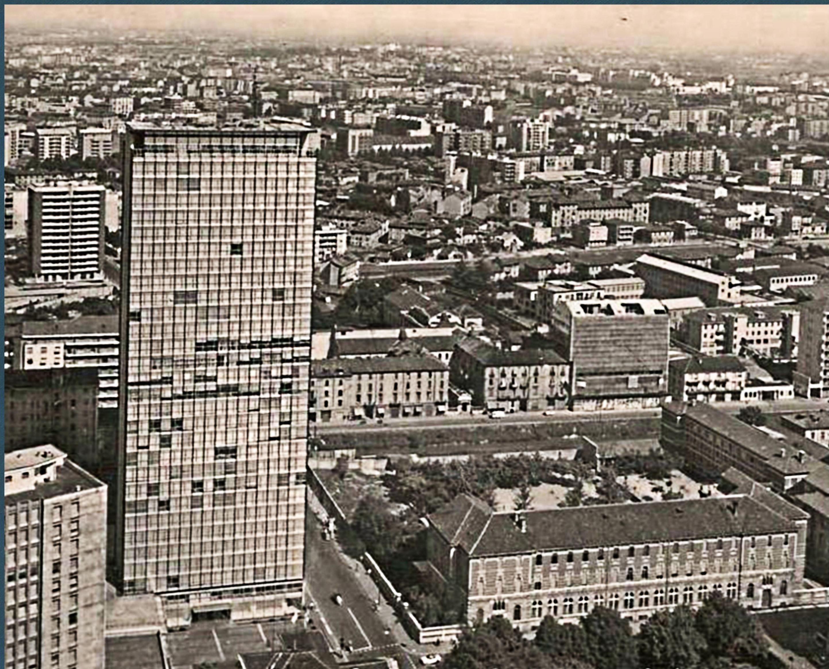
La Martesana prima della copertura vista dal Grattacielo Pirelli