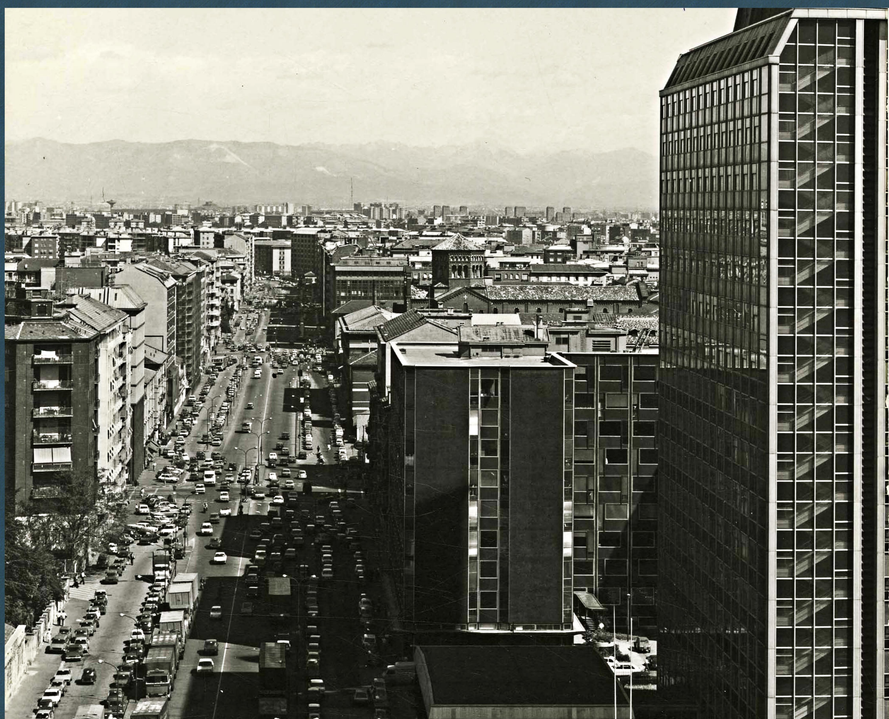
Via Melchiorre Gioia in seguito alla copertura del Naviglio