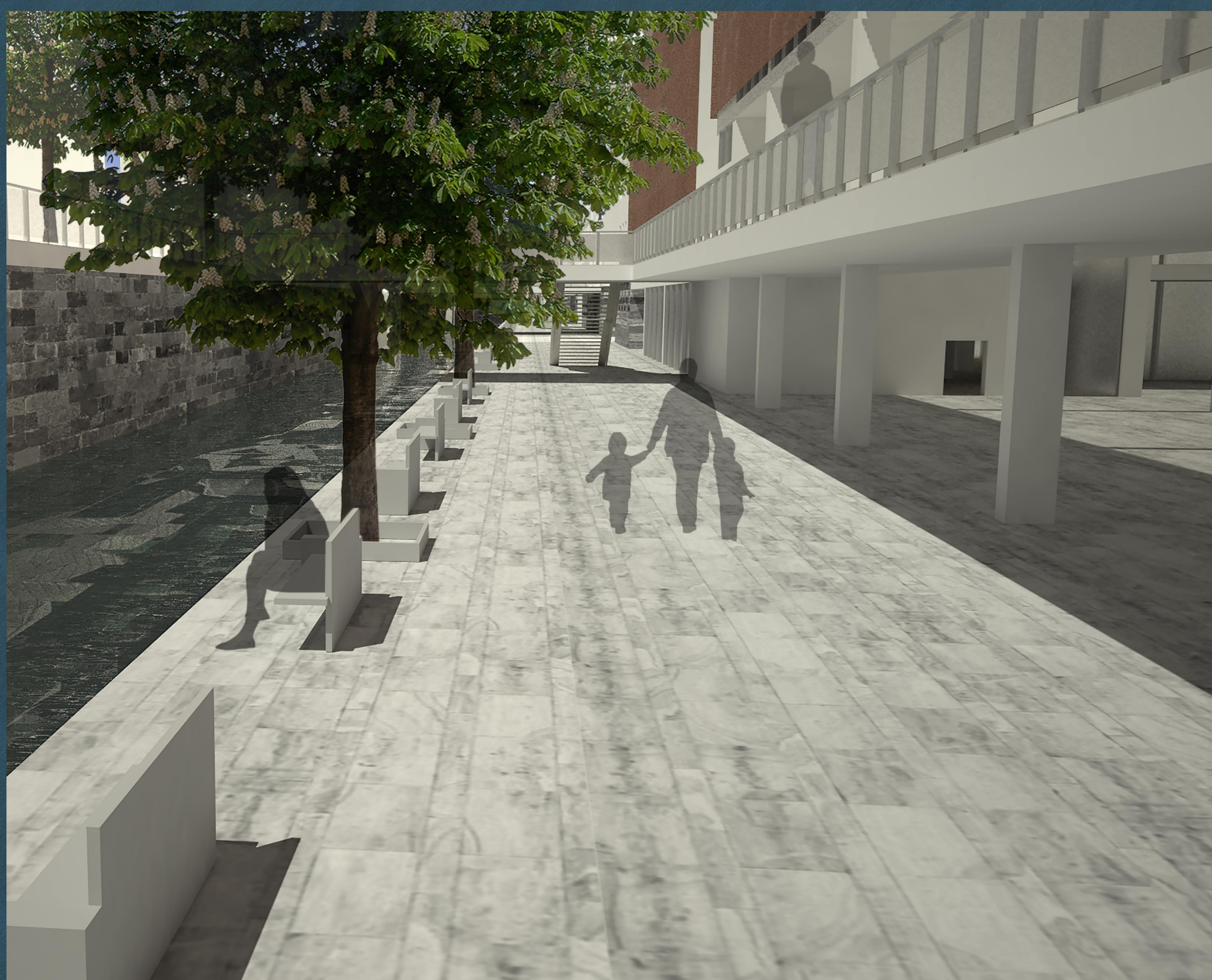
Vista della Martesana alla quota della passeggiata