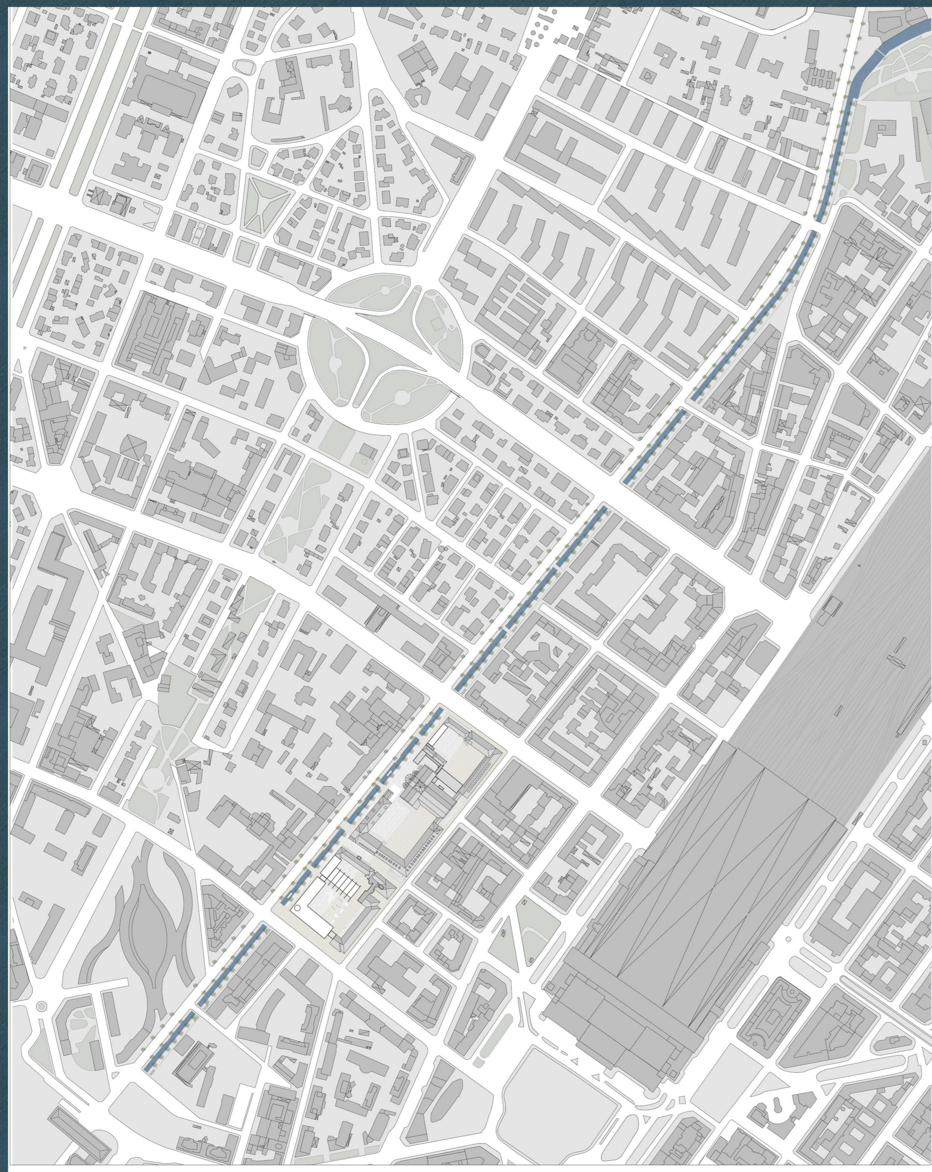
Area d'interesse del progetto di riapertura