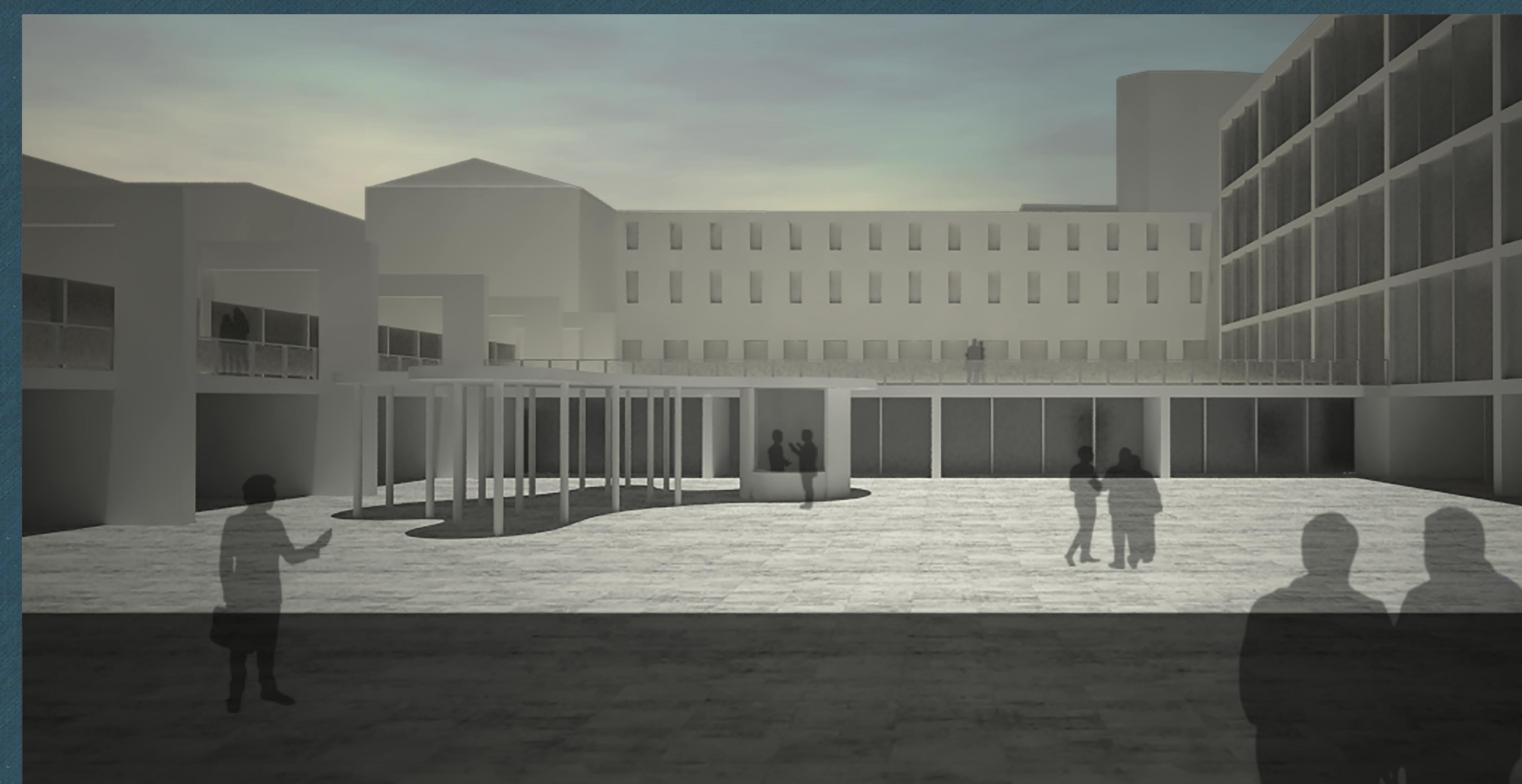
Vista della corte interna di progetto dalla passeggiata