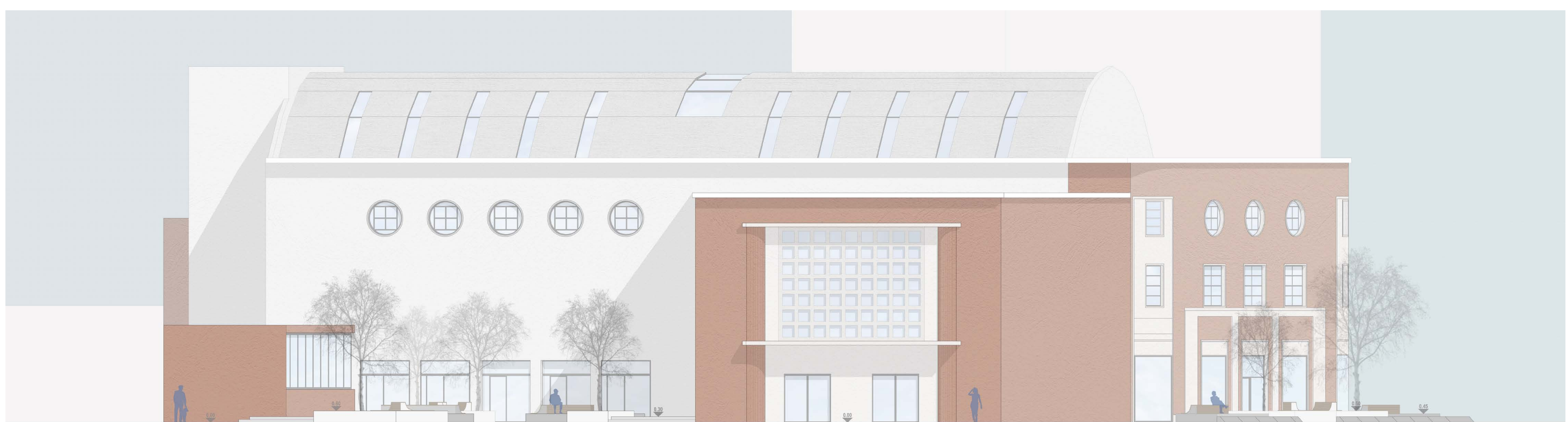
PROSPETTO OVEST _Scala 1:100