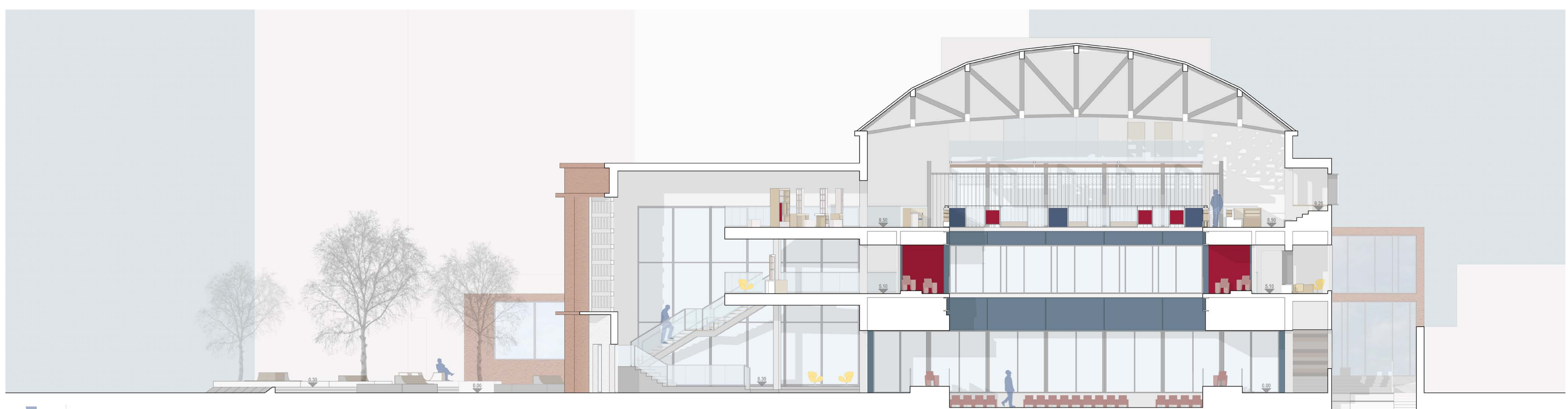
SEZIONE B-B' _Scala 1:100