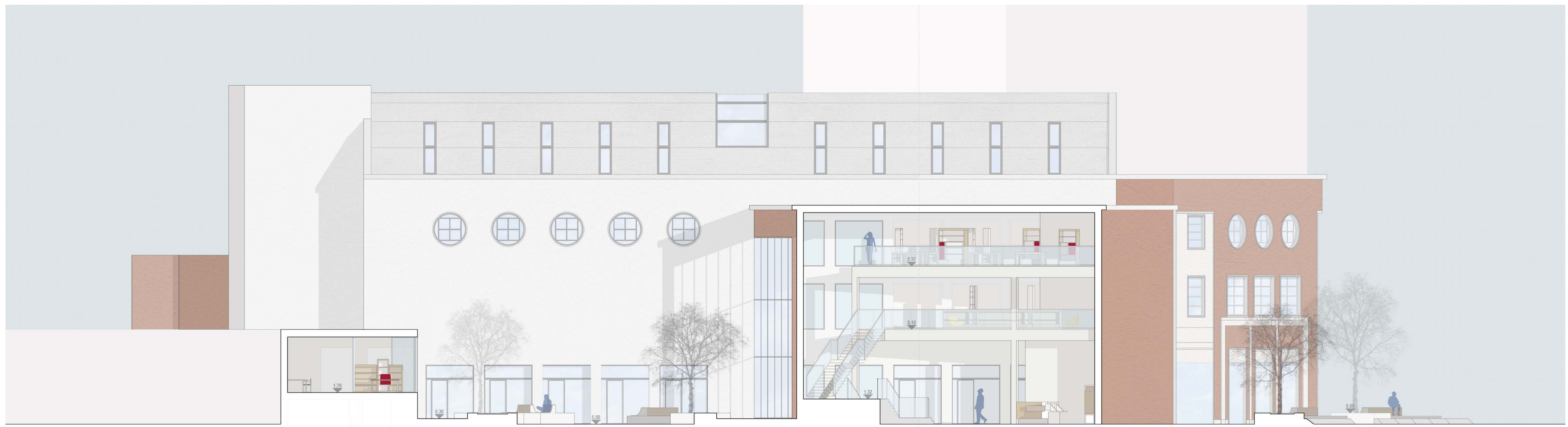
SEZIONE A-A' _Scala 1:100