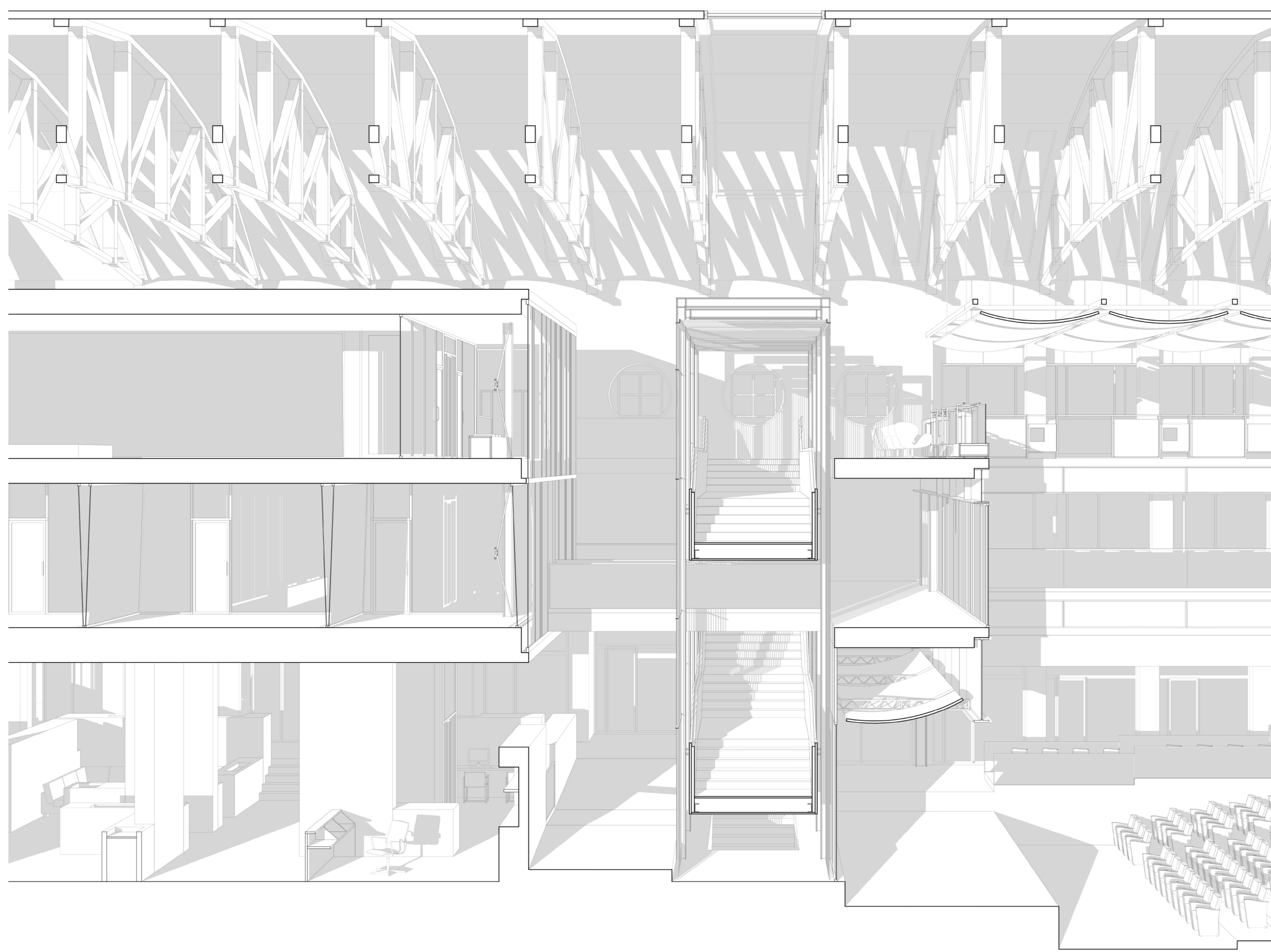
SEZIONE PROSPETTICA LONGITUDINALE_Scala 1:50