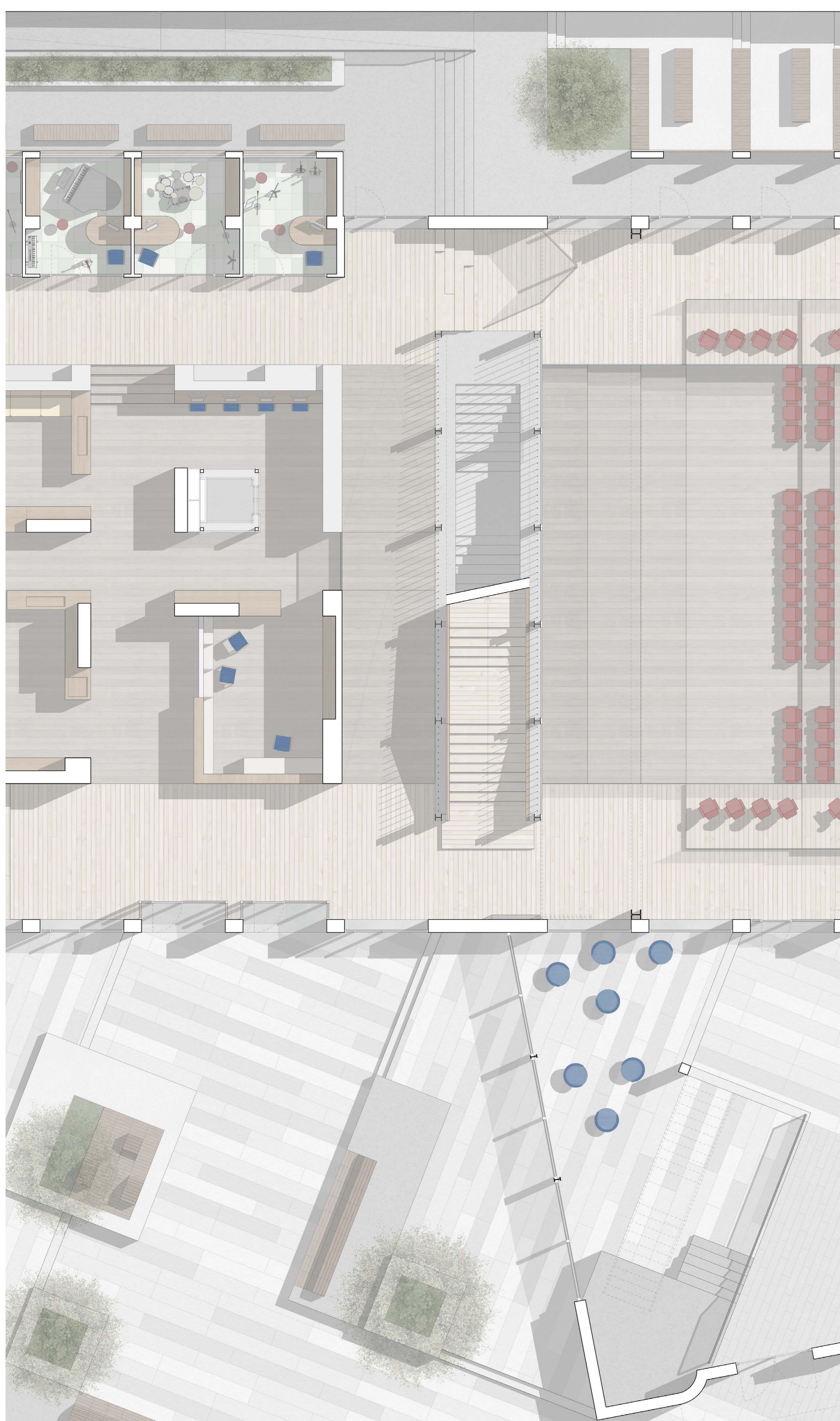
PIANTA PIANO TERRA_Scala 1:50