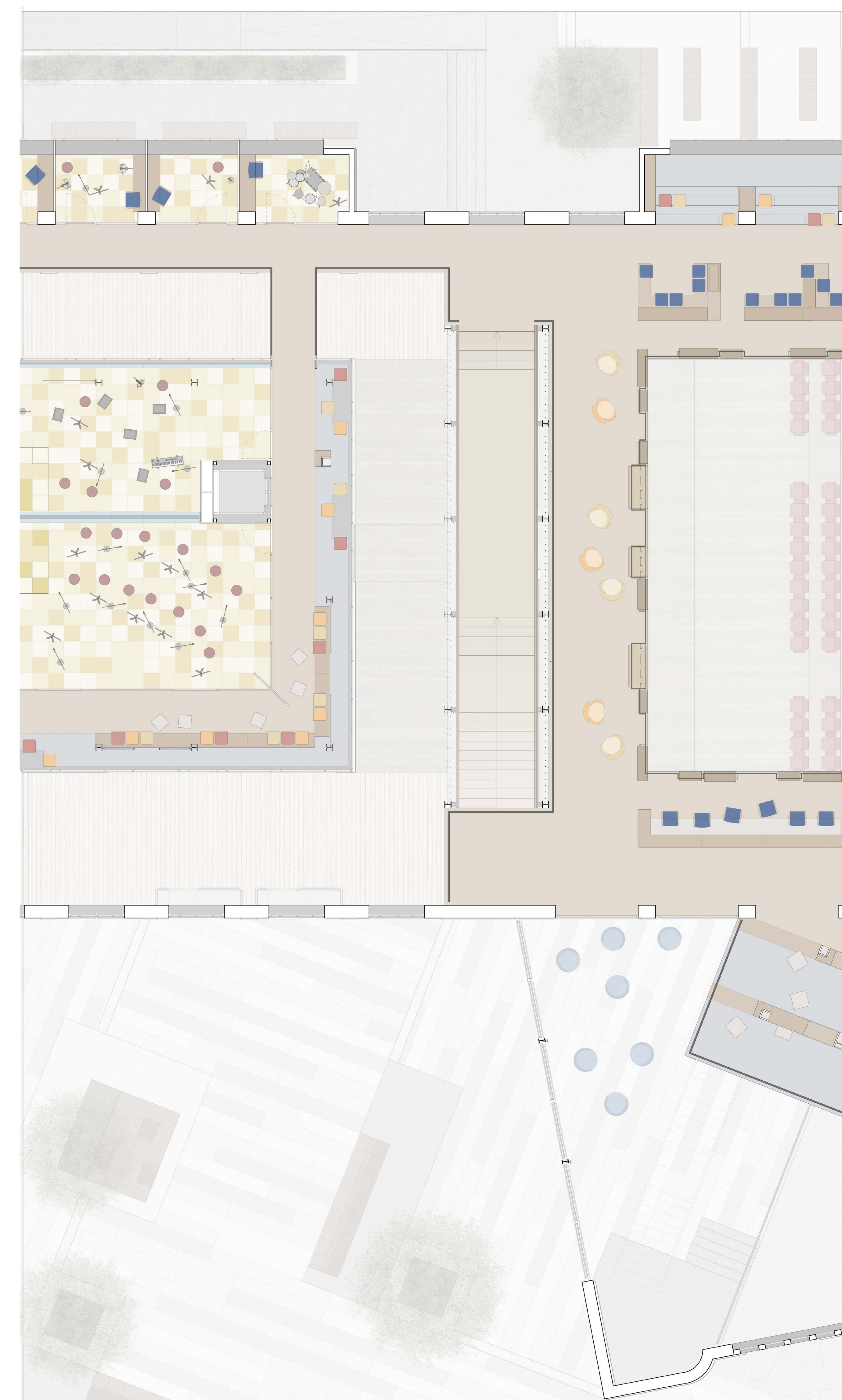
PIANTA SECONDO PIANO_Scala 1:50