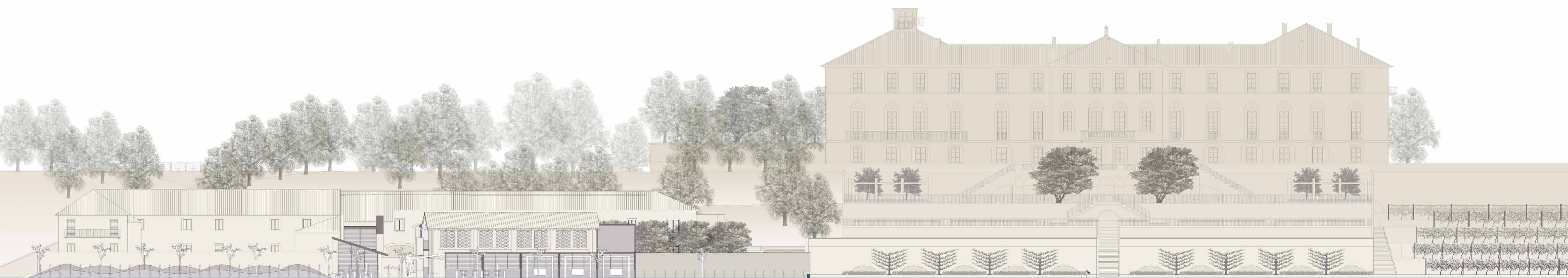
Prospetto Sud - scala 1:150