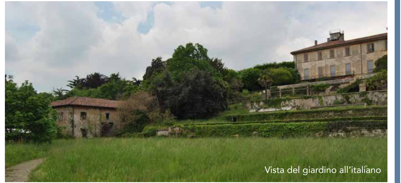
Vista del giardino all'italiana