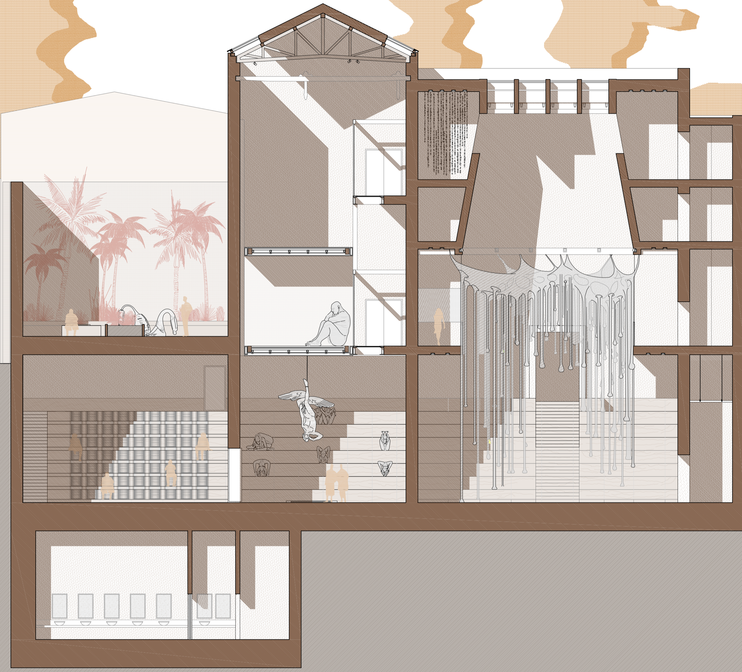
Sezione II Scala 1:100