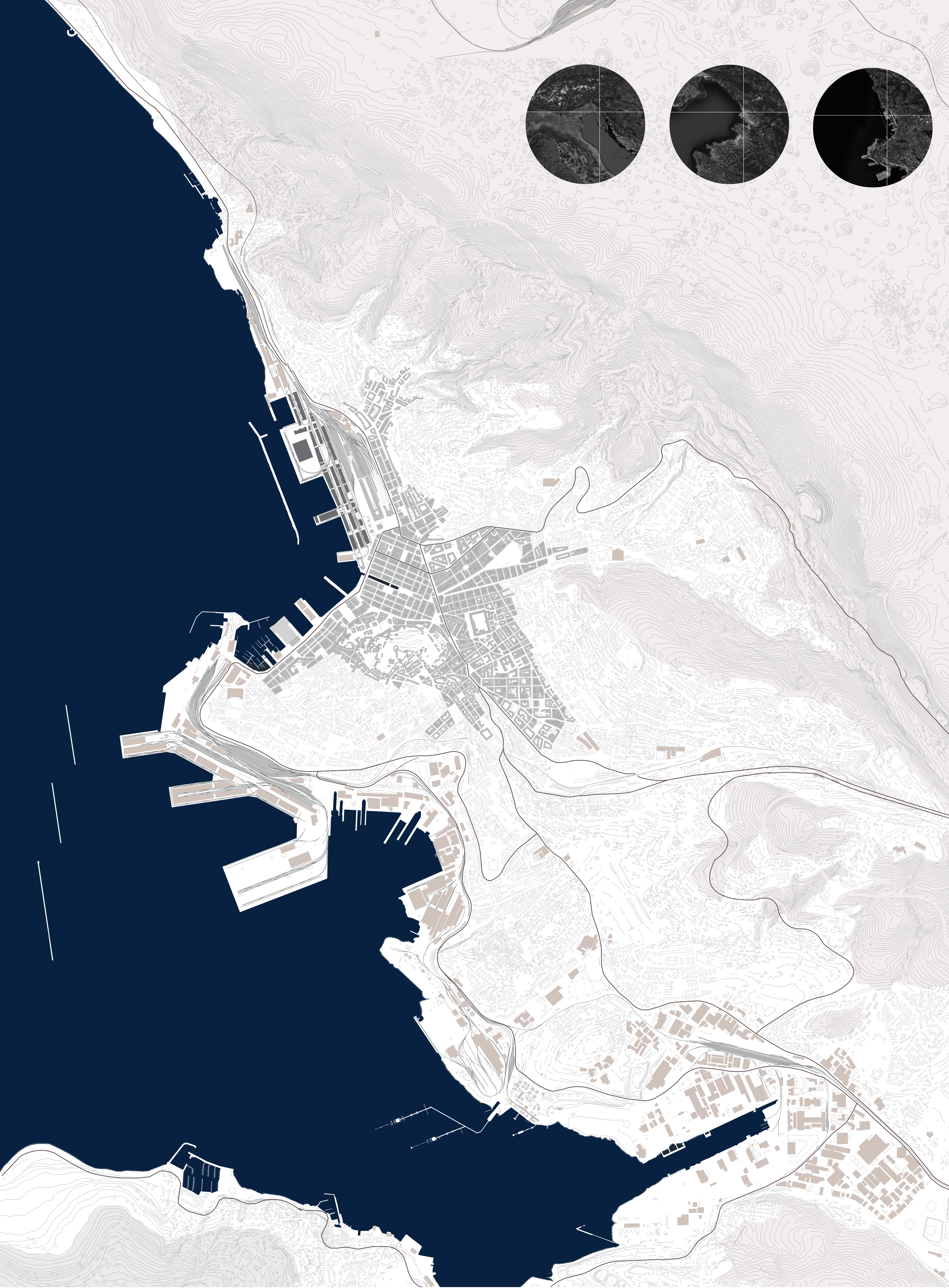
SINTESI DESCRITTIVA DEL CONTESTO URBANO DI TRIESTE Scala 1:15000