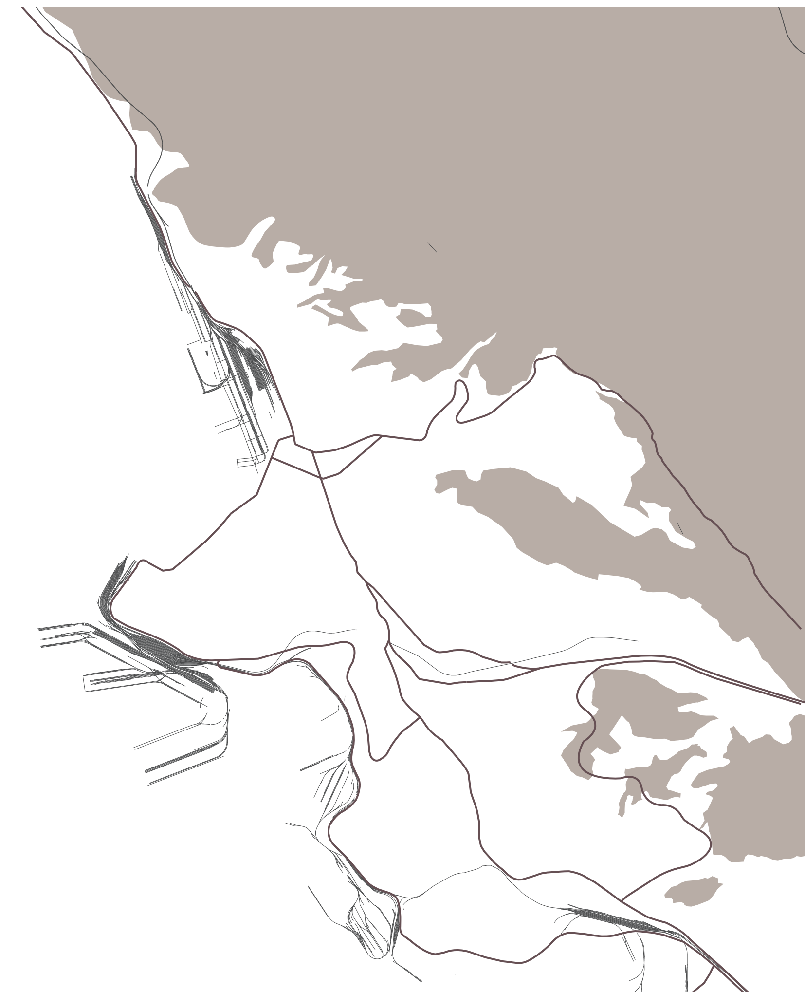
GERARCHIA DEI PRINCIPALI TRACCIATI