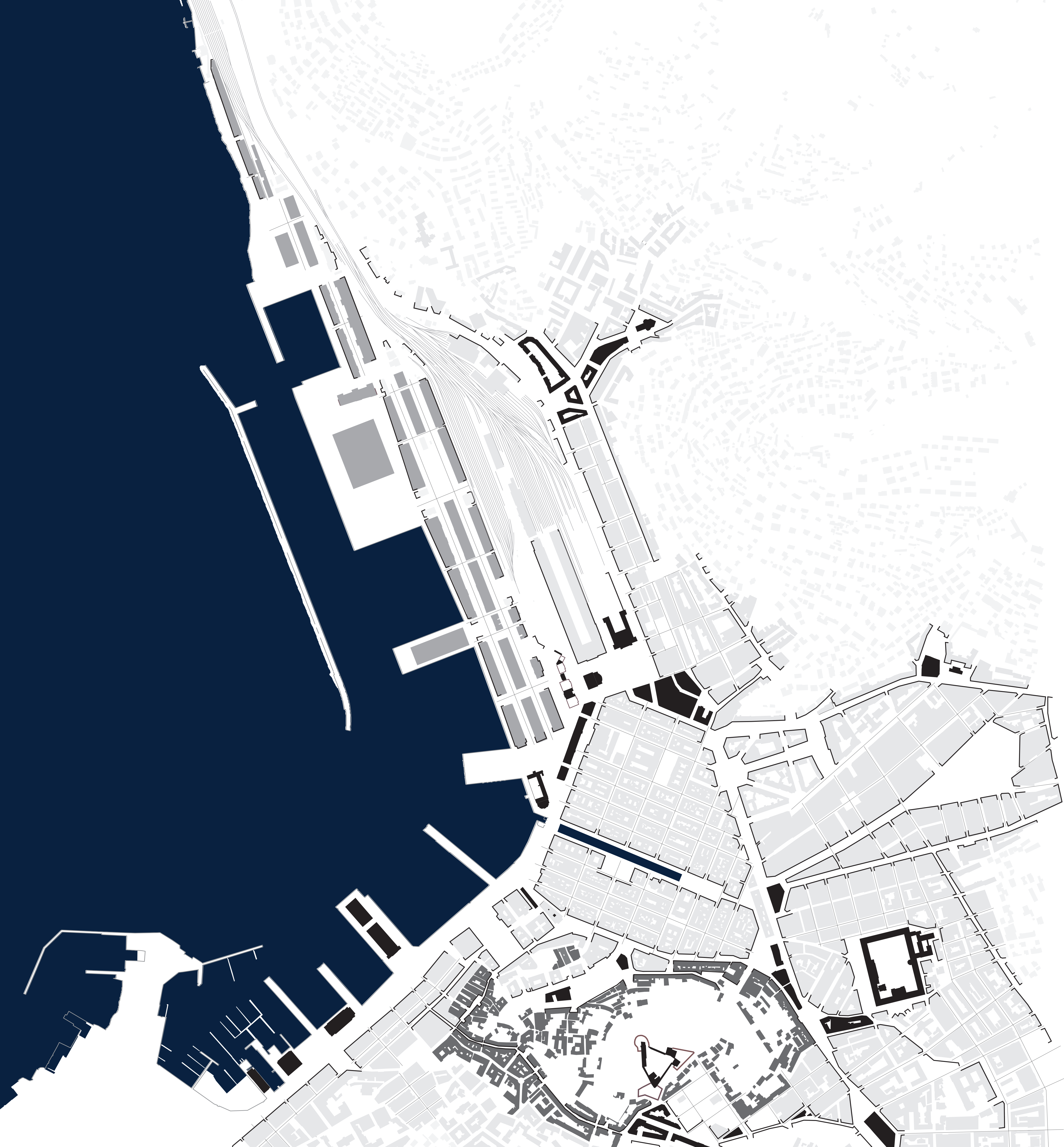
DESCRIZIONE DEL TESSUTO URBANO Scala 1:10000