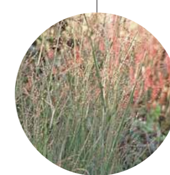
Panicum virgatum 'Heavy Metal'