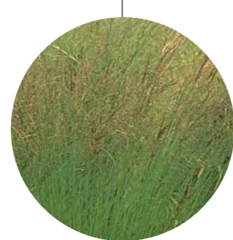
Molinia caerulea 'Heidebraut'