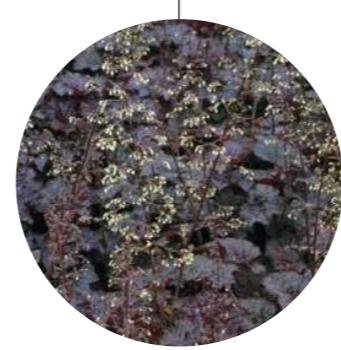
Heuchera micrantha 'Palace Purple'