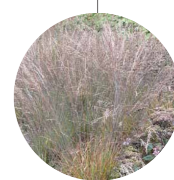
Molinia caerulea 'Edith Dudzus'