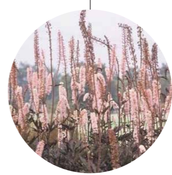
Cimicifuga ramosa 'Atropurpurea'