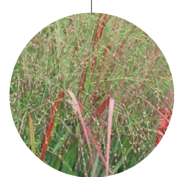
Panicum virgatum 'Rehbraun'