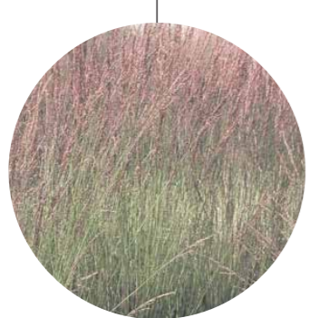
Molinia caerulea 'Moorhexe'