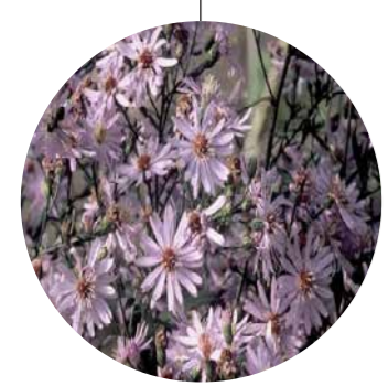
Aster amellus 'Sonora'