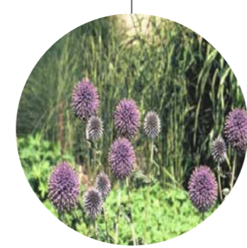
Echinops banmaticus 'Taplow Blue'