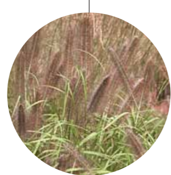
Pennisetum alopecuroides 'Viridiscens'