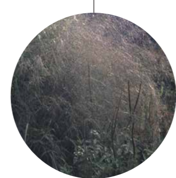
Molinia caerulea 'Transparent'