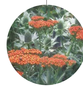
Achillea 'Walter Funcke'