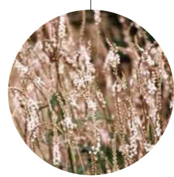
Persicaria amplexicaulis 'Alba'