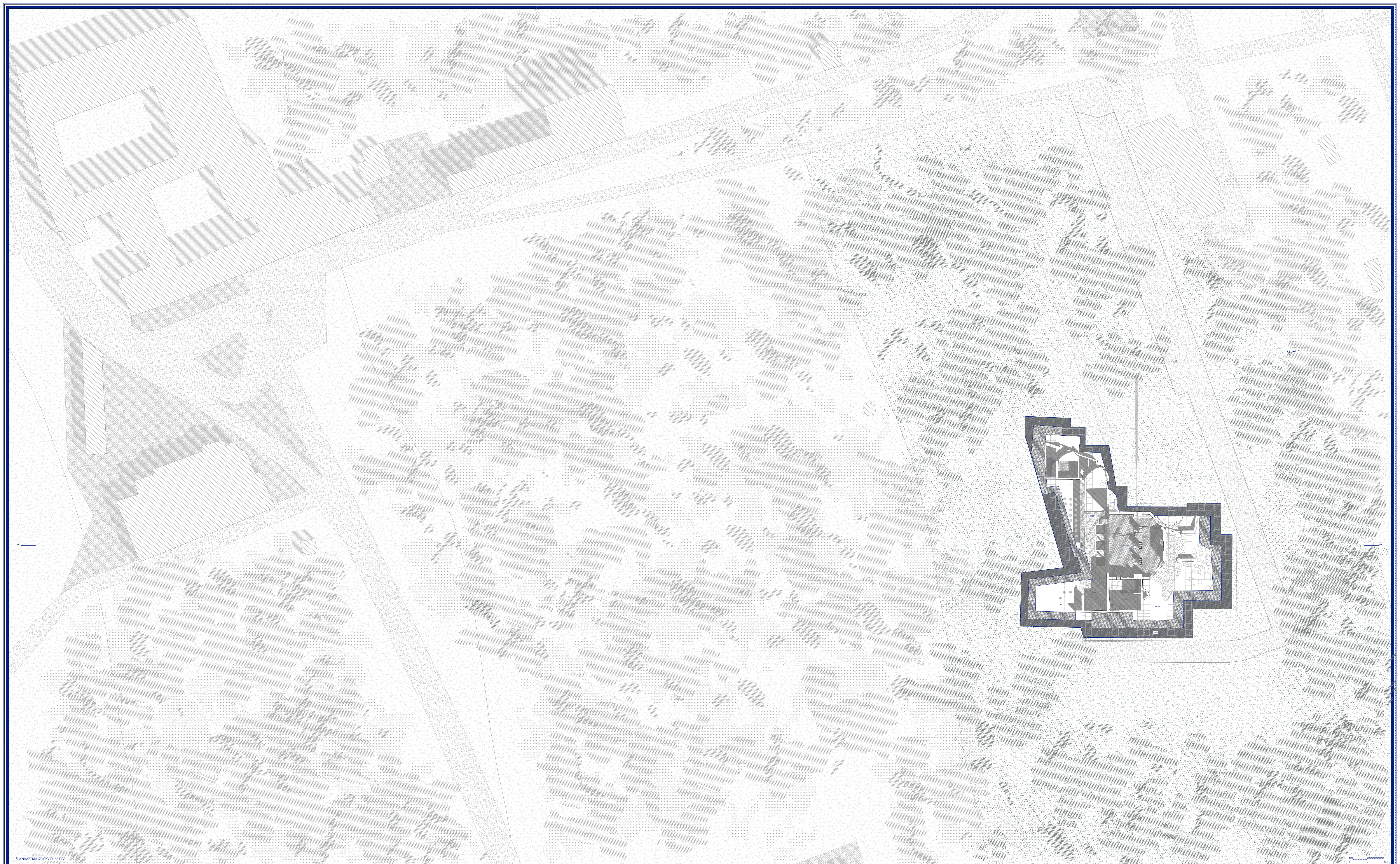
PLANIMETRIA STATO DI FATTO