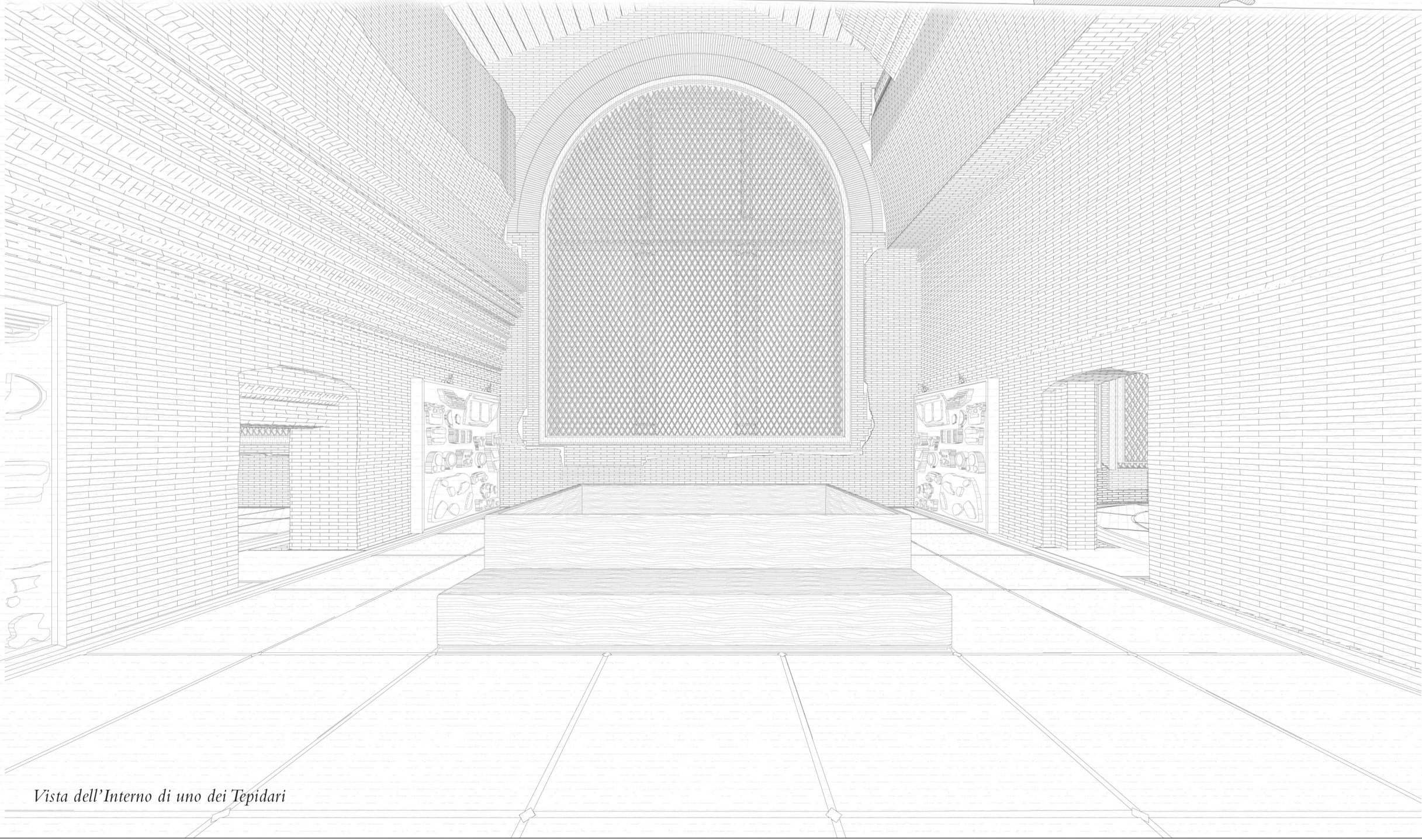
Vista dell'Interno di uno dei Tepidari