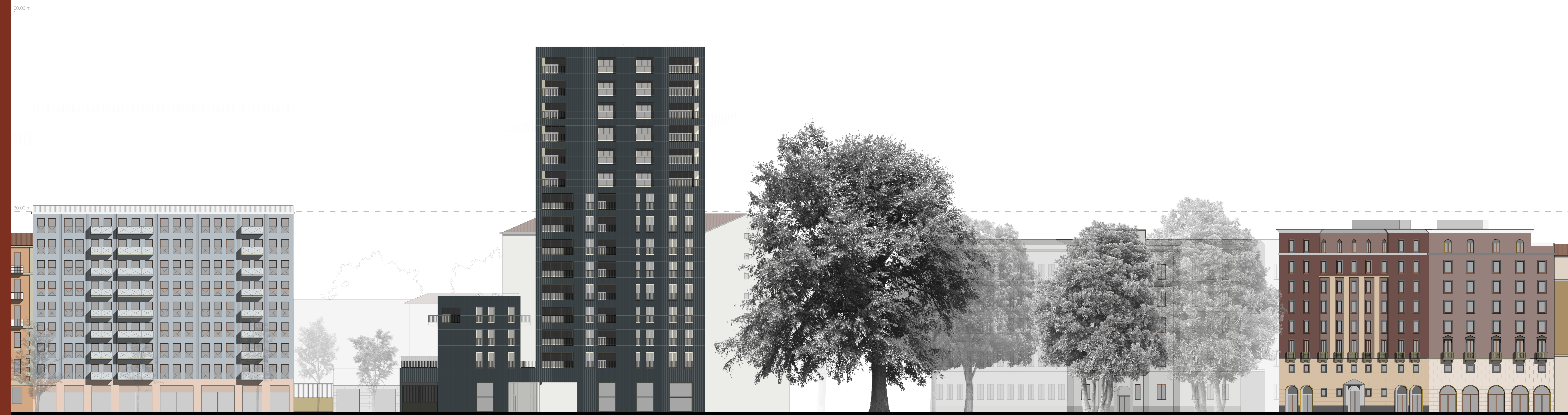
PROSPETTO SUD - OVEST 1: 200