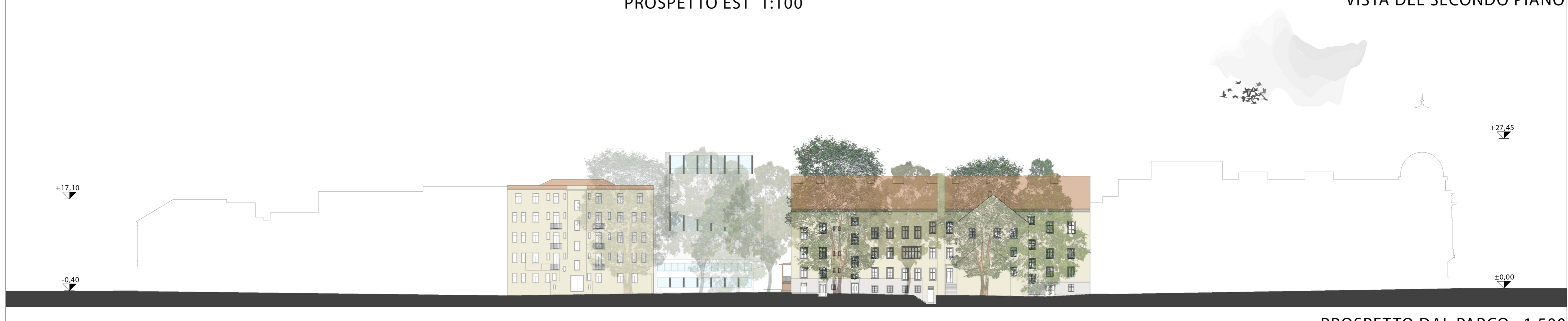
PROSPETTO DAL PARCO 1:500