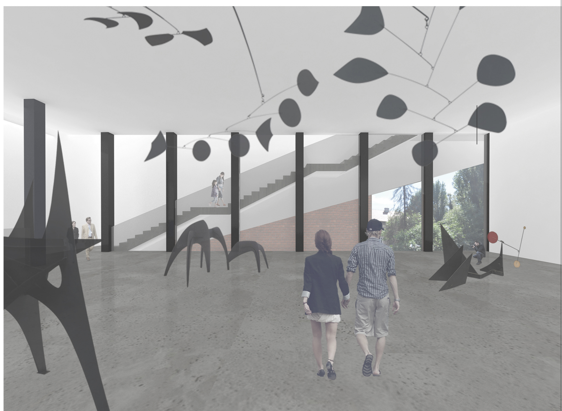
VISTA DEL SECONDO PIANO