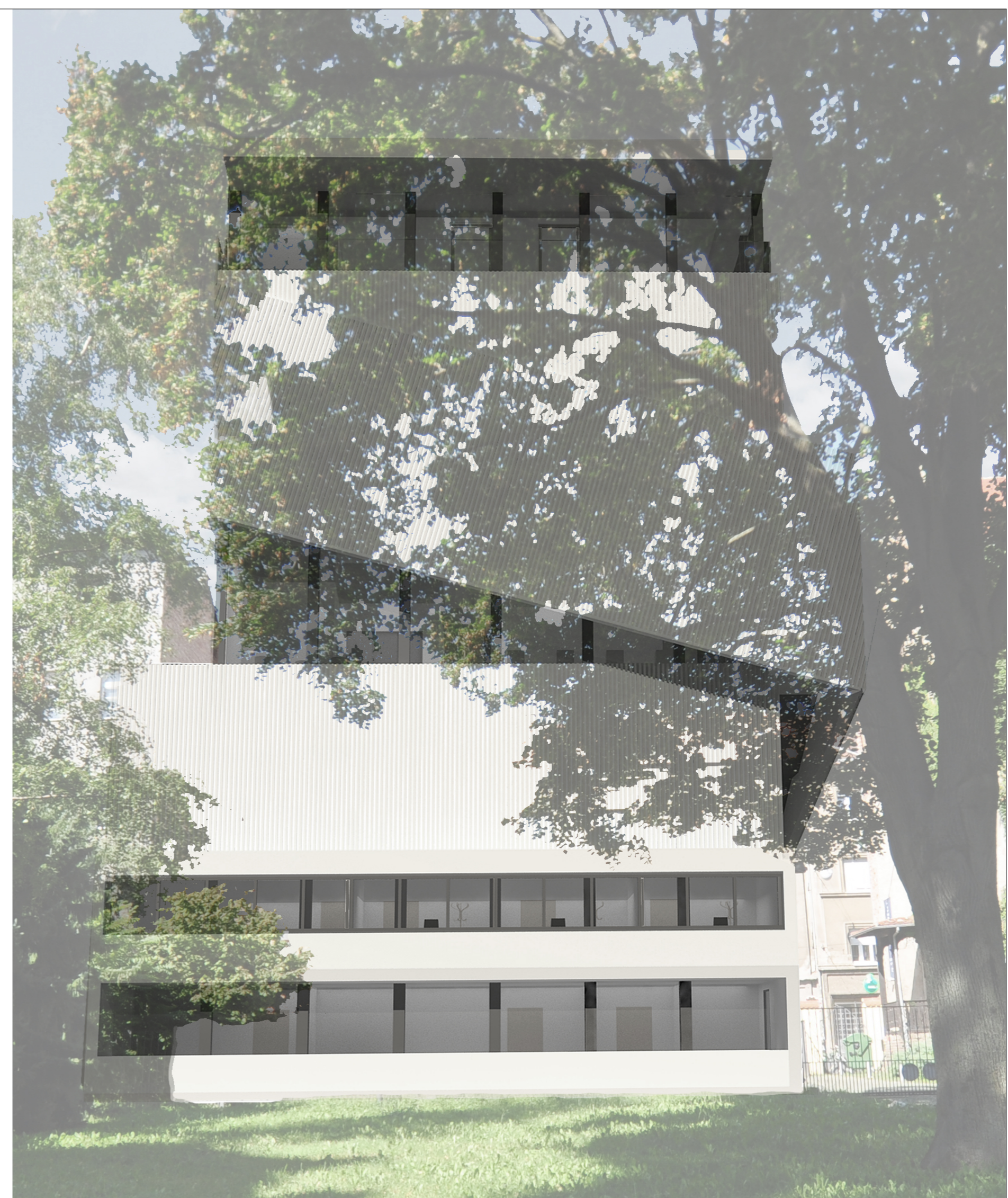
3. VISTA DAL PARCO