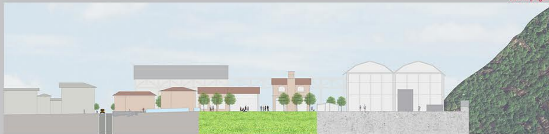
stato di progetto