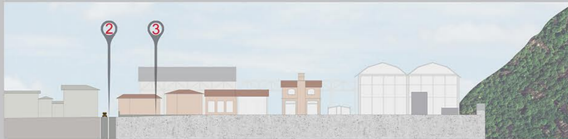
stato di fatto