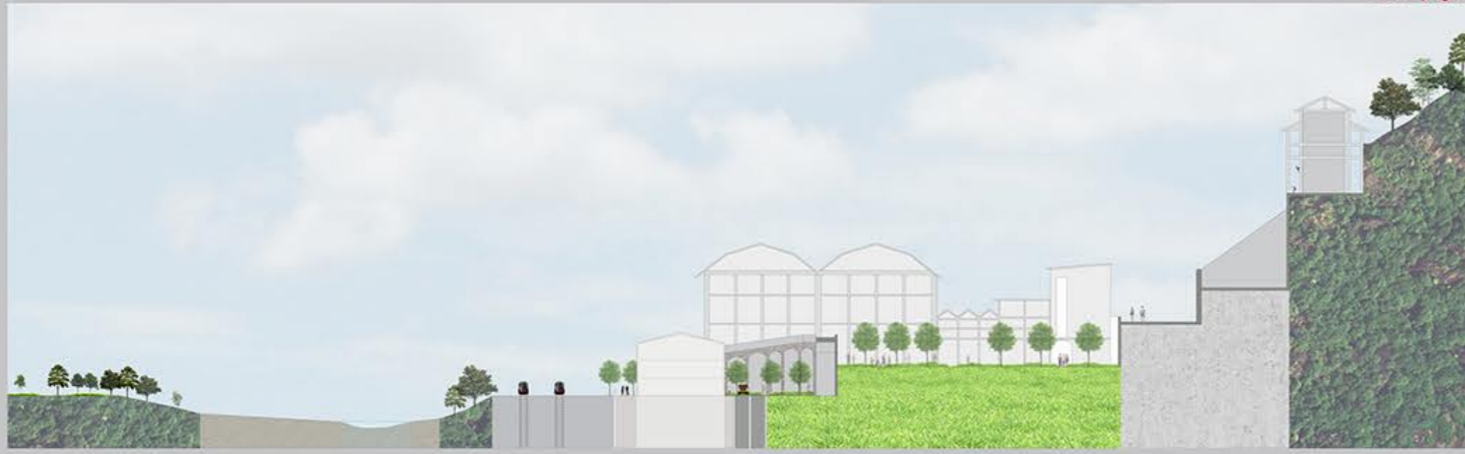
stato di progetto