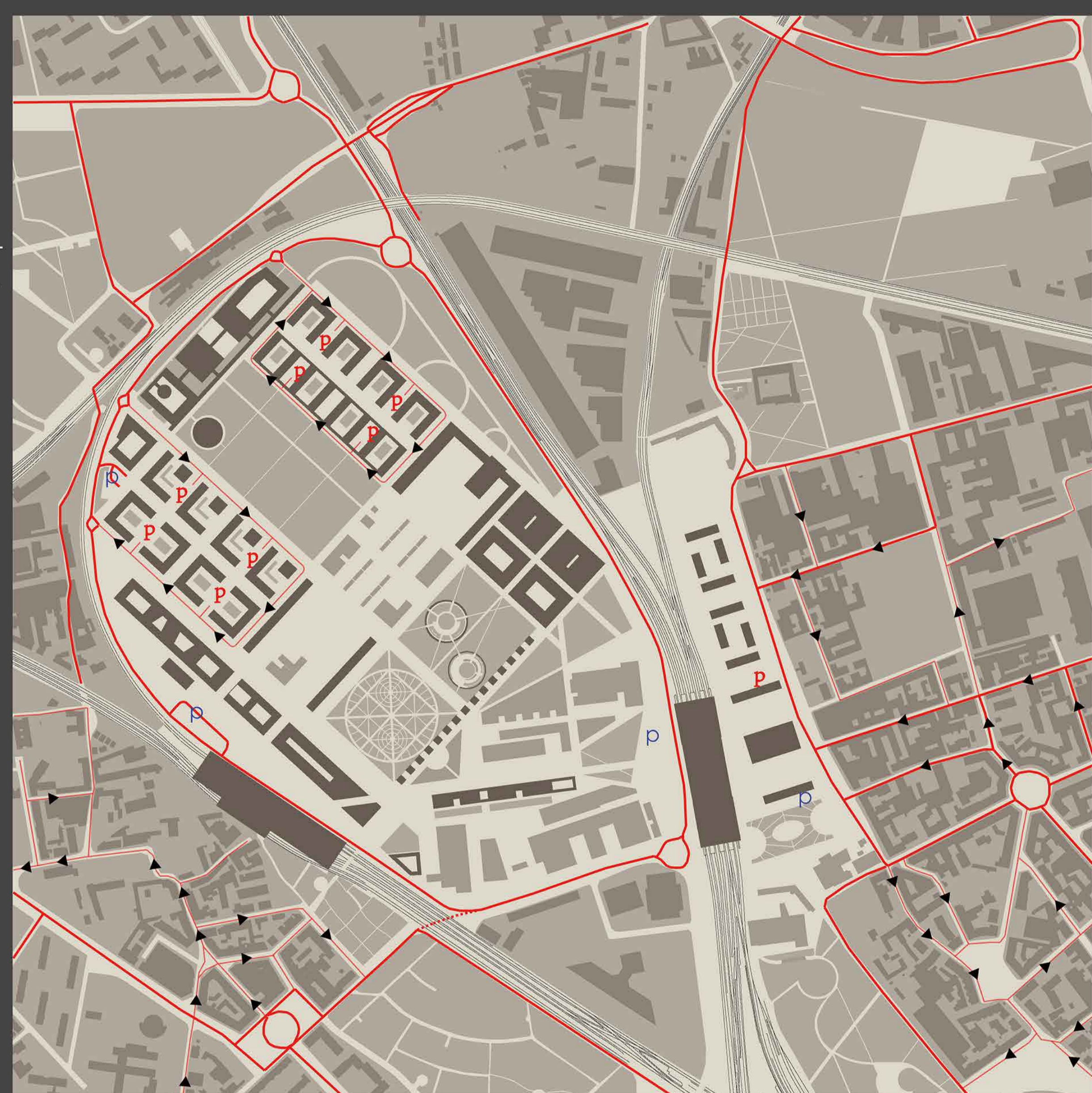
schema della viabilità' Le linee sottili rappresentano zone 30 vietate ai mezzi pesanti. I parcheggi pubblici sono contrassegnati da simbolo blu mentre quelli privati da simbolo rosso.