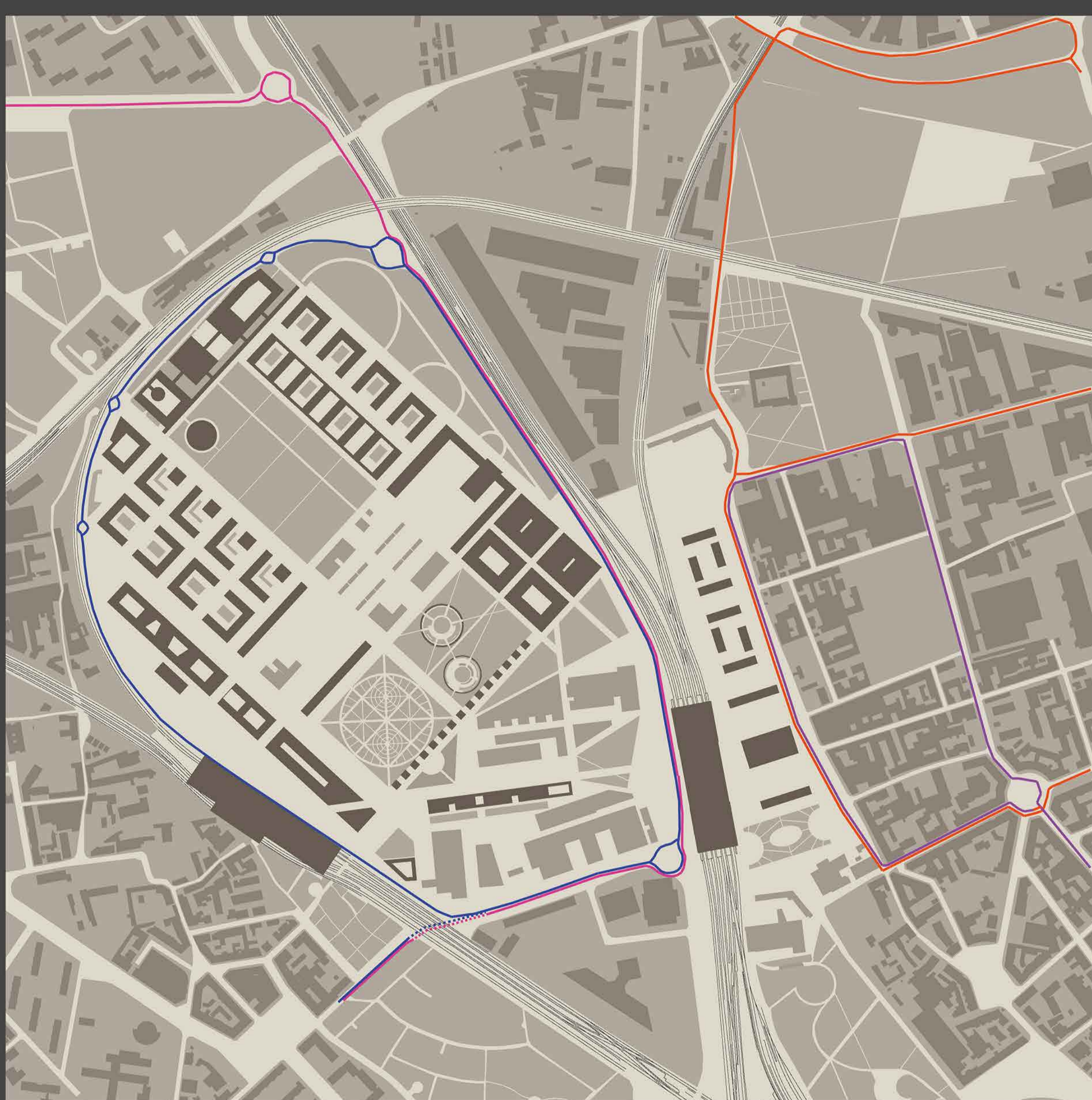
schema delle linee del trasporto pubblico che servono la Bovisa. Sono rappresentati le linee automobilistiche blue e rosa; la linea filoviaria 92; la linea automobilistica 82