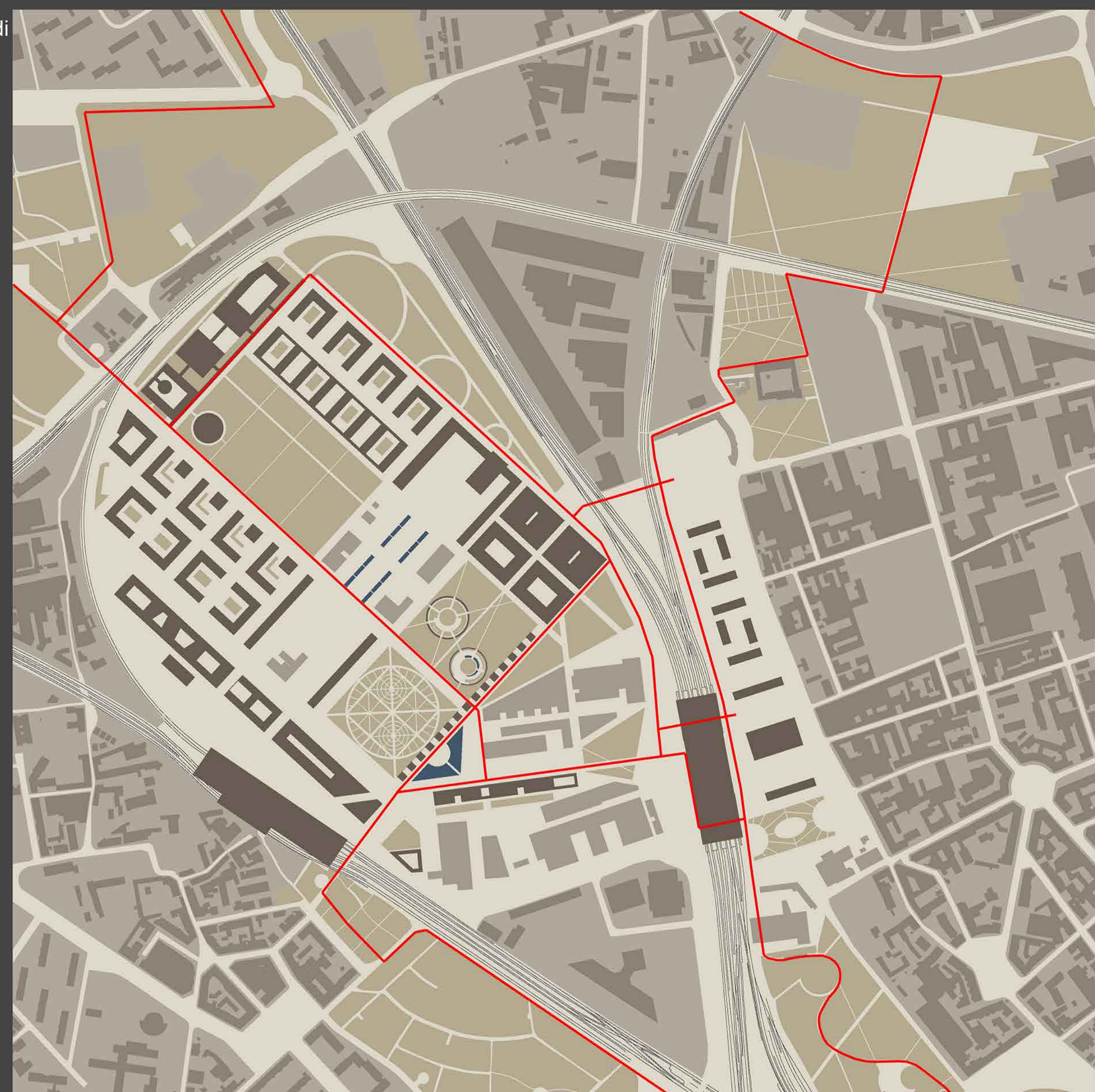
sistema delle aree verdi delle connessioni ciclopedonali . si nota la posizione baricentrica della Bovisa fra i parchi e le aree urbane circostanti.