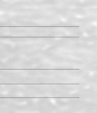
ALTIMETRIA DEL TERRENO