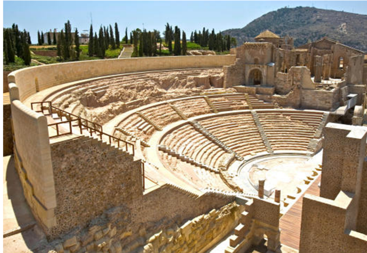
TEATRO ROMANO DI CARTAGENA_ RAFAEL MONEO