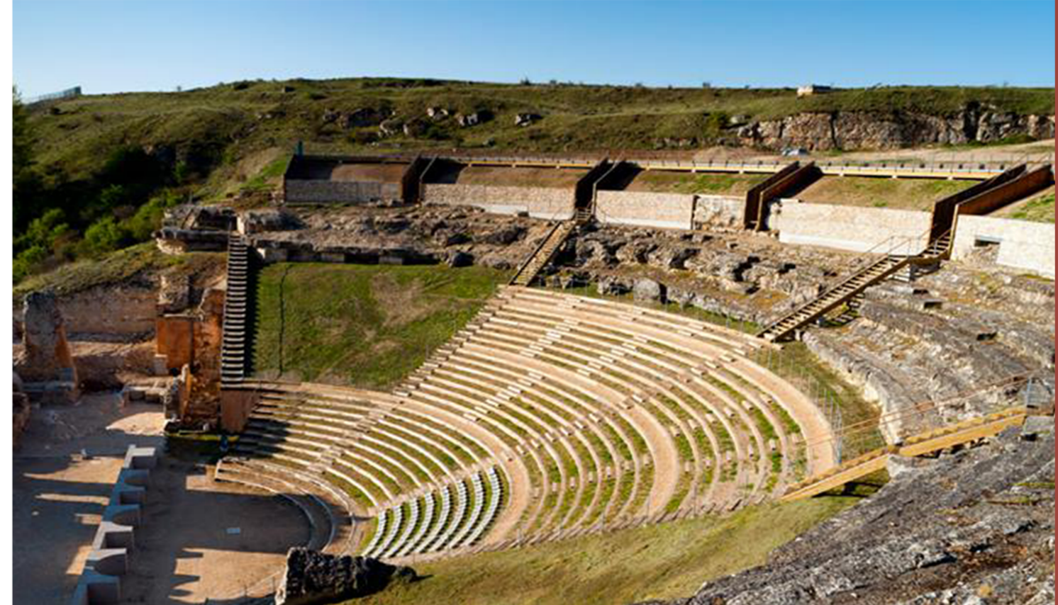
TEATRO ROMANO DI CLUNIA_ LAB PAP