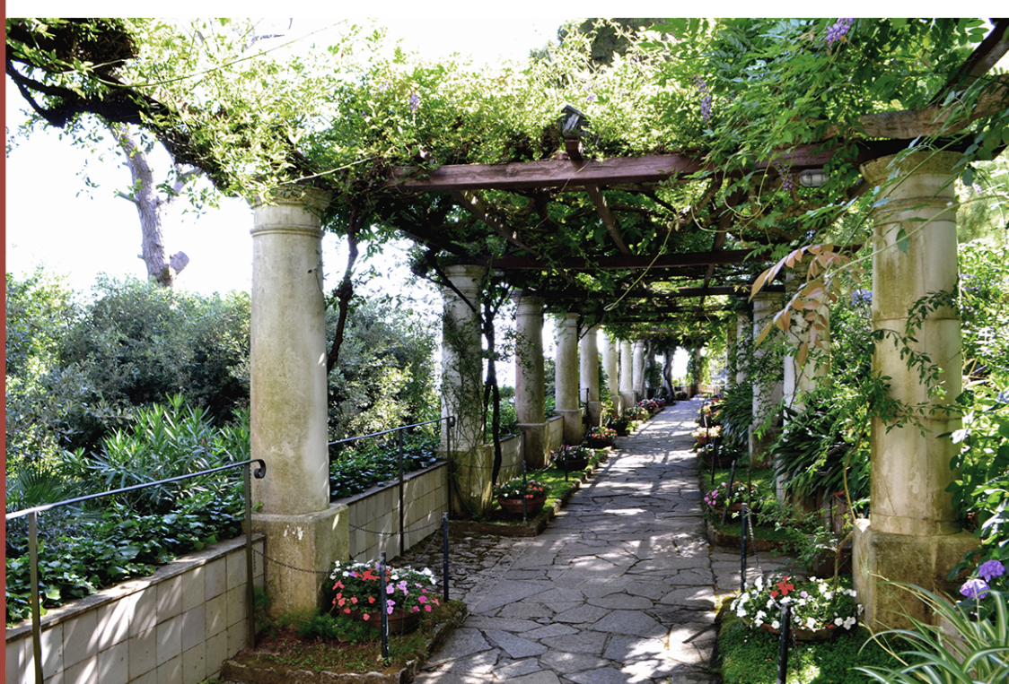
PORTICATO TRADIZIONALE DELLA COSTA AMALFITANA