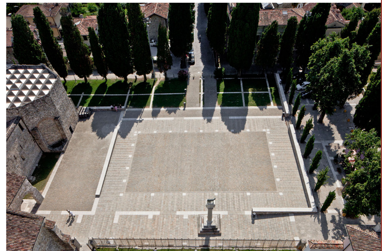
PIAZZA DELLA BASILICA DI AQUILEIA_