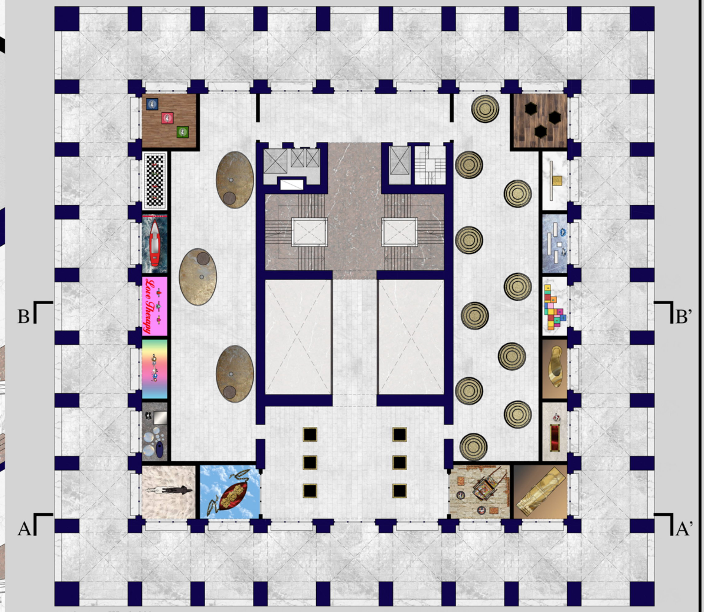
◆ pianta p. III 1:200