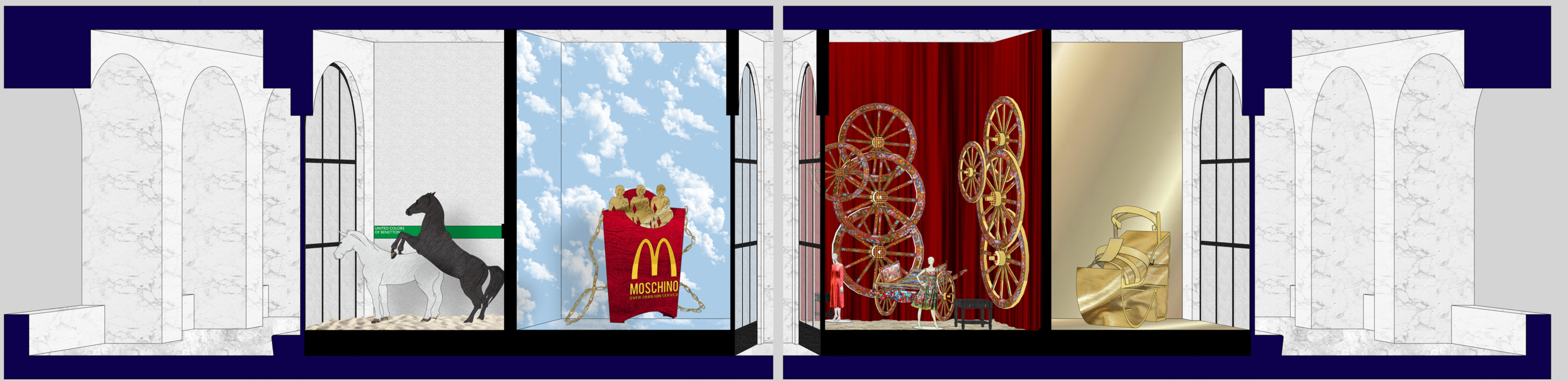
◆ sezione AA' 1:50