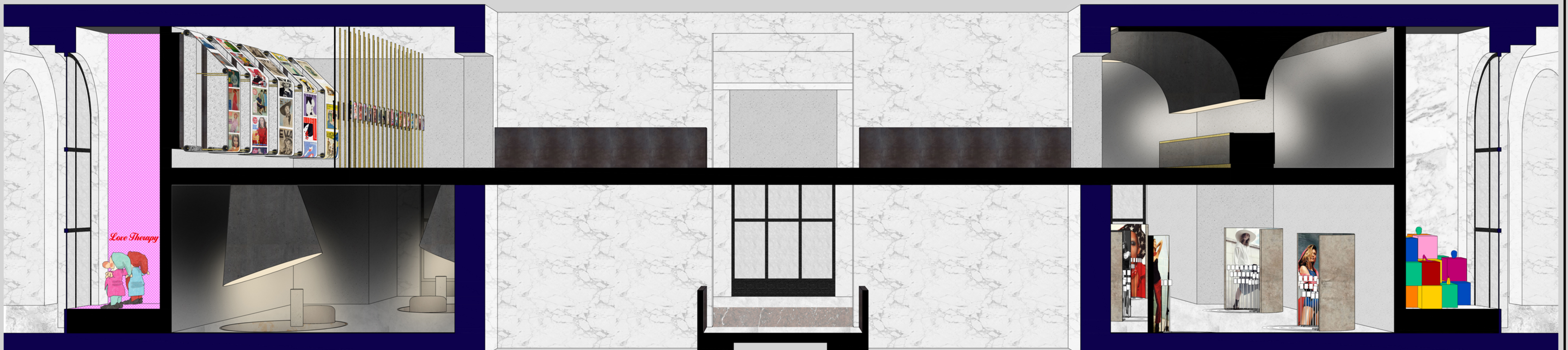
◆ sezione BB' 1:50