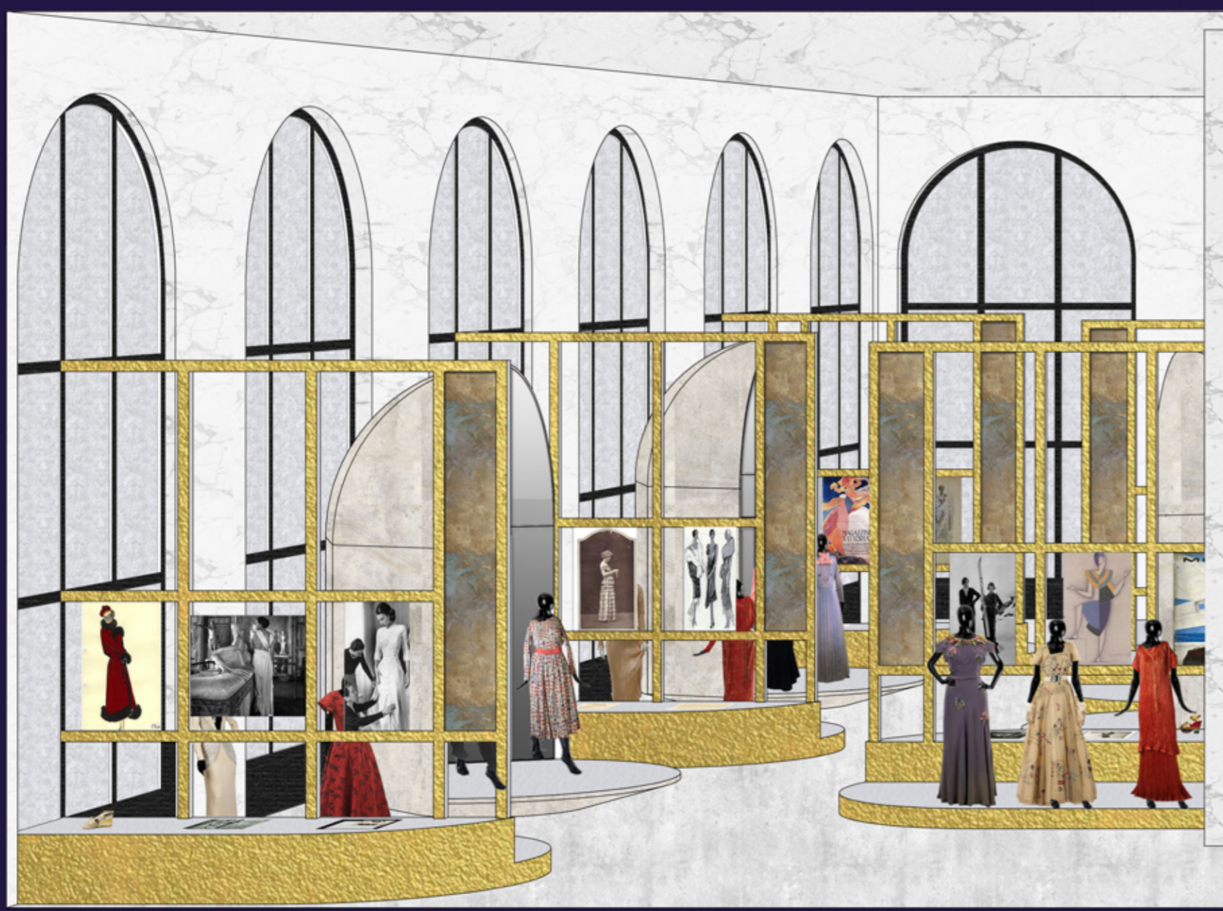
◆ sezione AA' 1:50

[Cosa] abiti collezione, documenti collezione