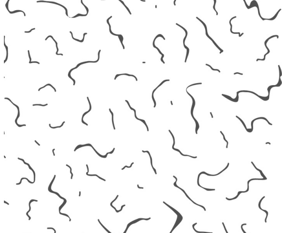
rivenditore, cicce 'u gnure

Dama è un progetto pensato per rivitalizzare il lungomare affacciato sul Mar Piccolo attualmente vissuto come un semplice luogo di passaggio. Dama è localizzata in un punto chiave antistante le case popolari con la più alta densità abitativa dell'isola. Si è scelto dunque questo punto proprio per rispondere alle più svariate esigenze. Attraverso il progetto si propongono molteplici possibilità di utilizzo grazie all'inserimento di differenti tipologie di arredi fruibili dalla sera al mattino con qualsivoglia umore. Questi dispositivi sono sparsi sull'area di progetto ma ben localizzabili sulle caselle che determinano lo spazio a livello della pavimentazione definiscandone un pattern. Queste caselle servono a identificare agevolmente le "pedine" le quali tramite l'applicazione possono farsi consegnare a "domicilio" il cibo ordinato. Quest'ultimo verrà portato dai diversi rivenditori al chiosco adiacente la Dama, dove verrà cucinato e servito.