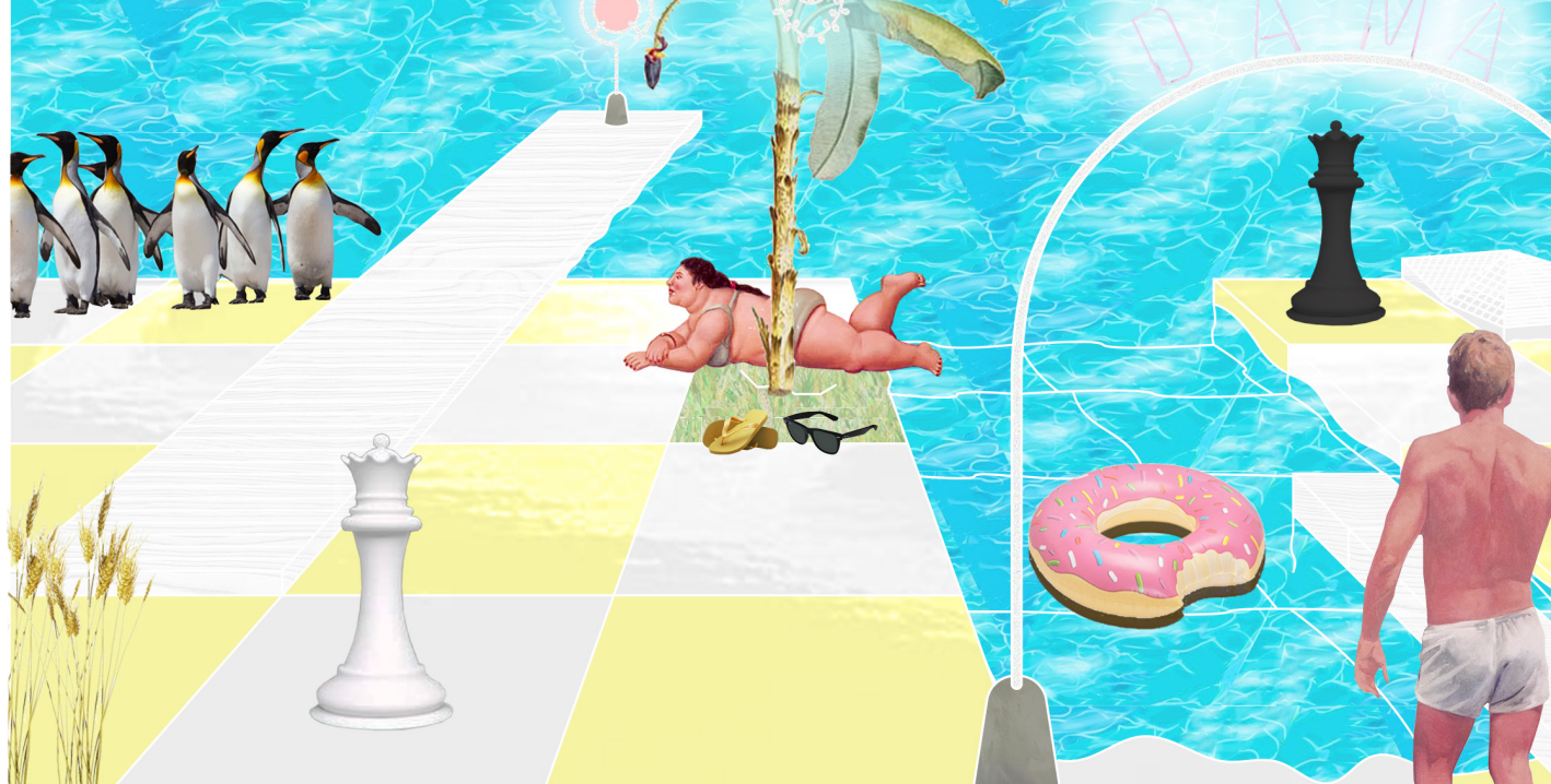
dama {la}o mare}