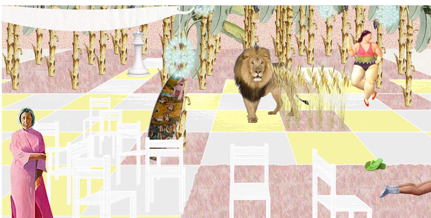
dama {la}o strada}