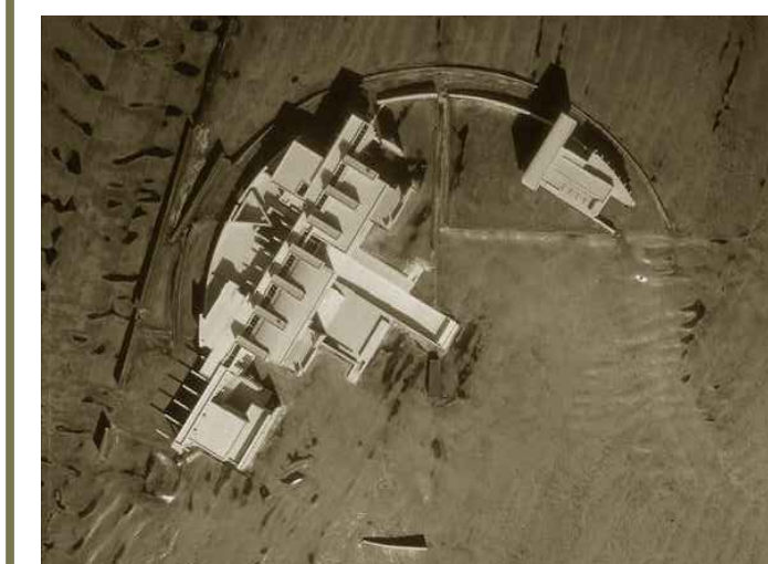
Cranford Residence, Morpeth, California, 1991