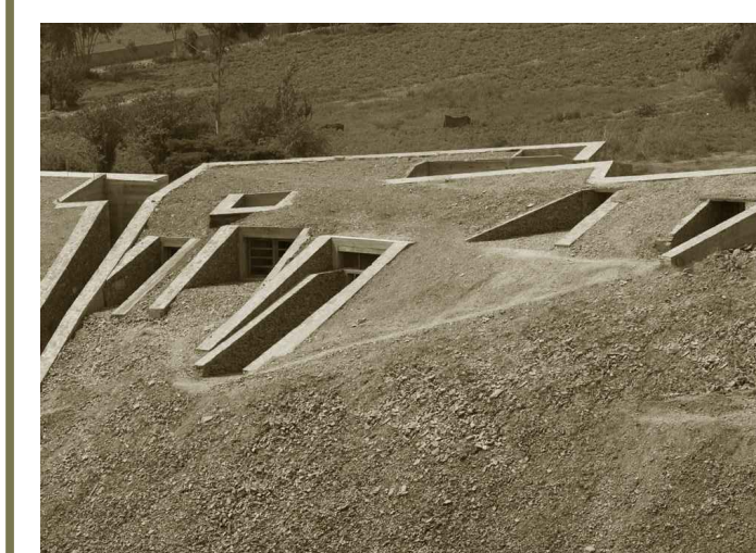
Pinocchio House, Longhi Architects, Perù, 2008