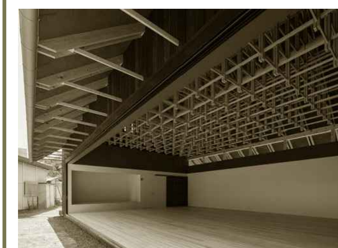
Sala da tea, FT Architects, Tokyo, 2013