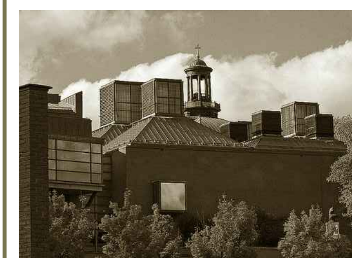
Madrasa Masoud, Rijad, Marocco, 1998