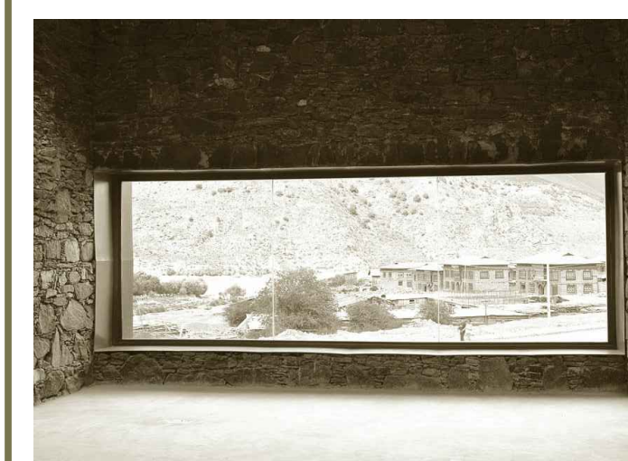
Tiba Nanchuan Visitor Centre, Soudan, Cina, 2008