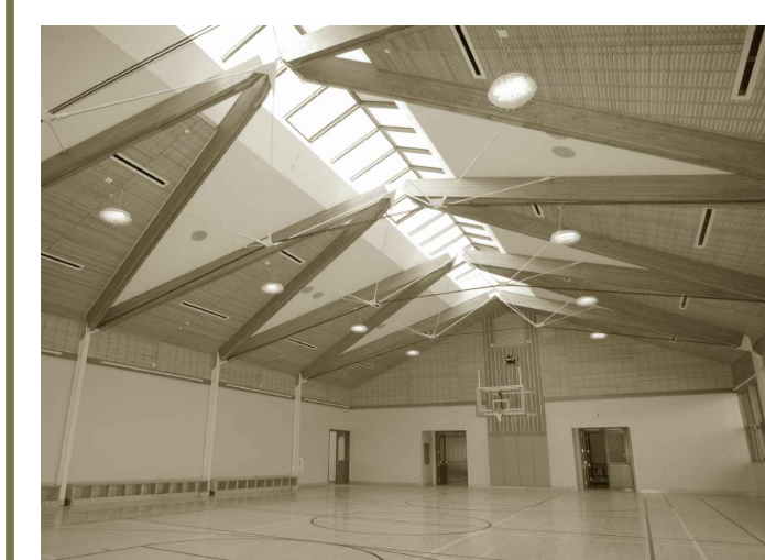
Yosemite Town Centre, Sausalito, California, 2011