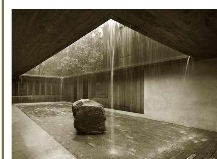
Copper House II, Sudio Mumbai, India, 2010