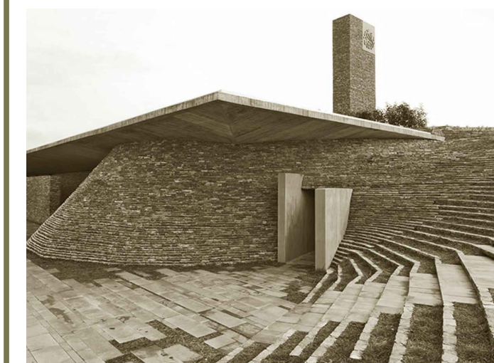
Sinakler Mosque, Enne Architects, Istanbul, 2012