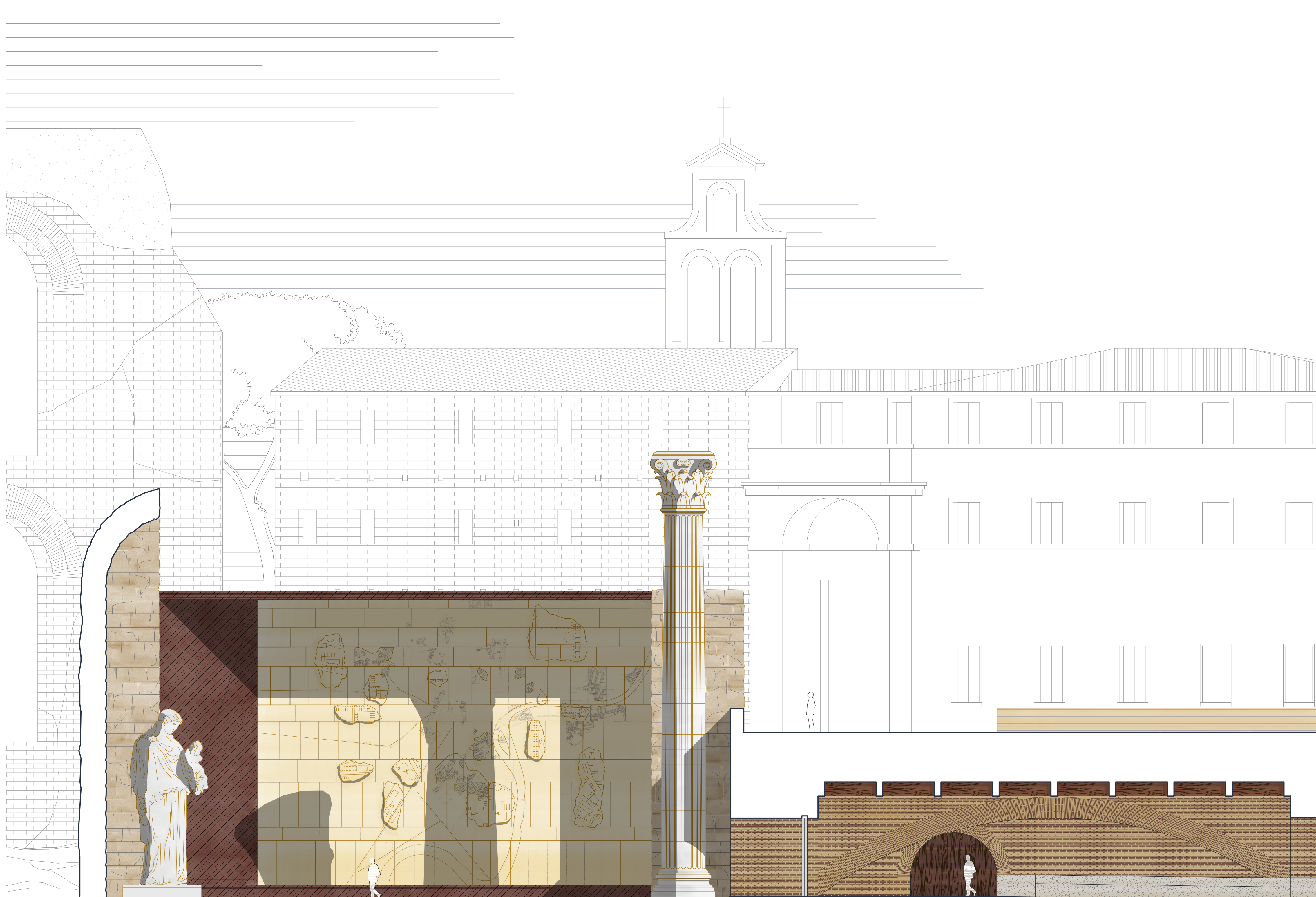
immagine XVIII. FORMA URBIS ROMAE - sezione longitudinale, scala 1:100