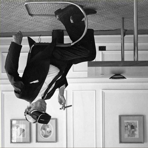
Ludwig Mies van der Rohe

OGNI SERVIZIO >> DEVE GIOVARE 'ALLA COMUNITA' <<