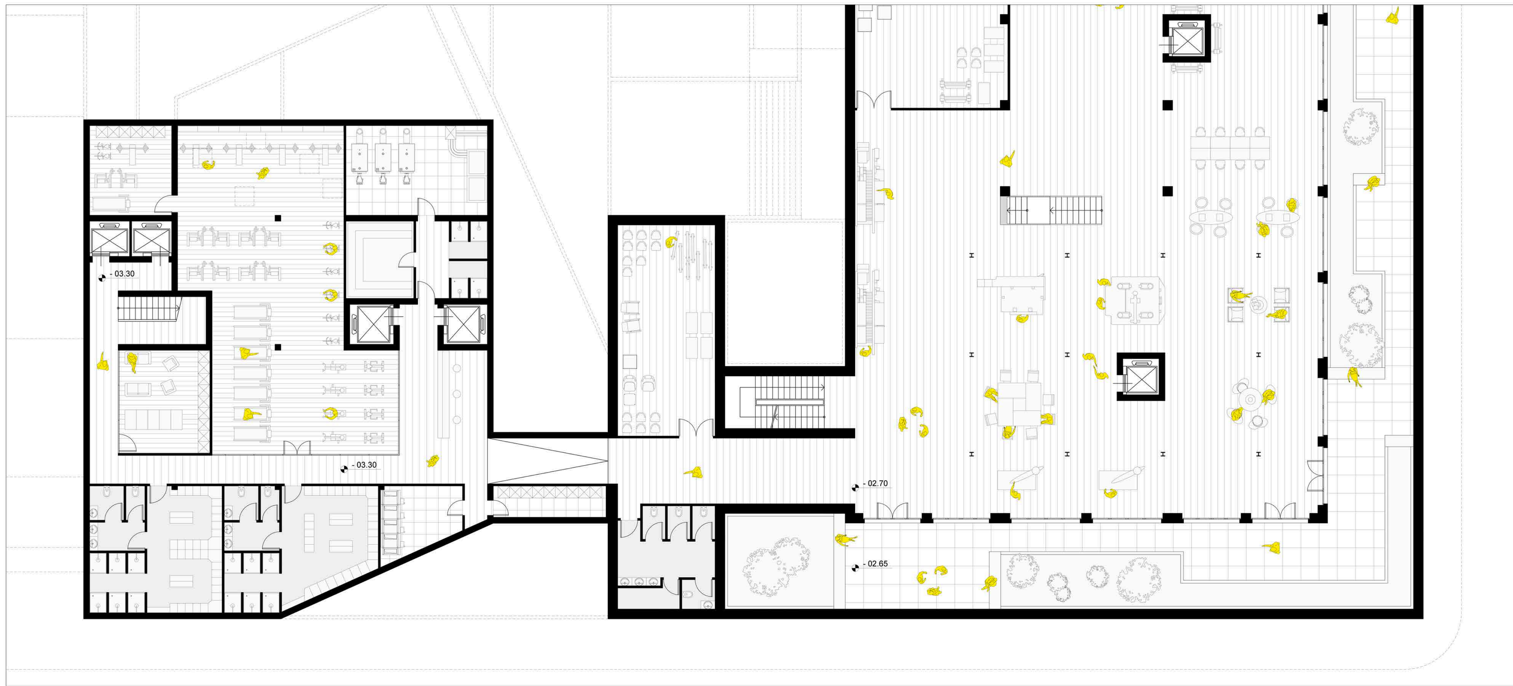
Pianta livello - 03.30 m