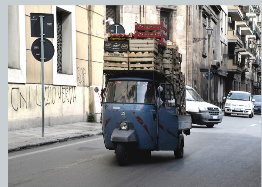
CORSO VITTORIO EMANUELE