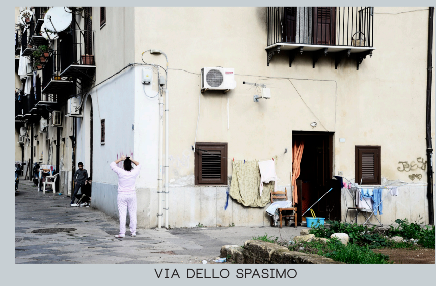
VIA DELLO SPASIMO