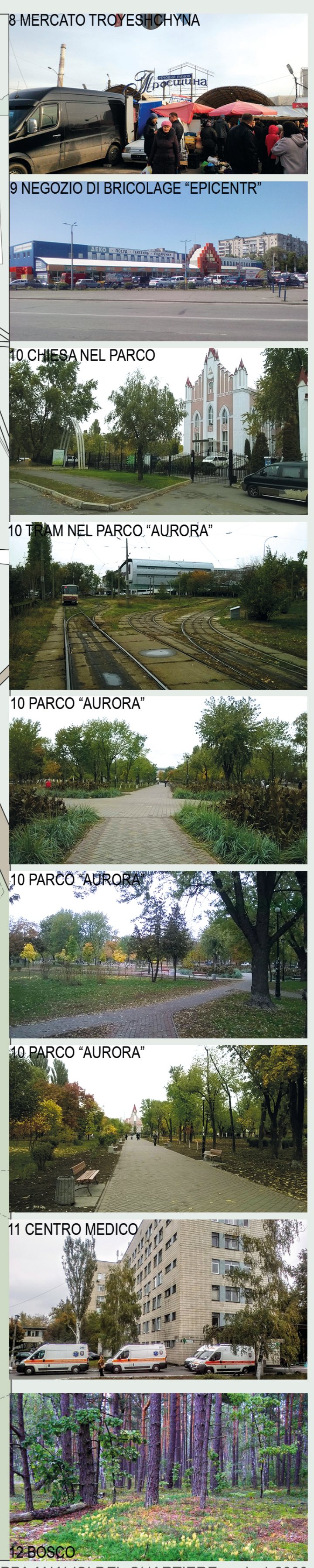
MAPPA ANALISI DEL QUARTIERE scala 1:2000