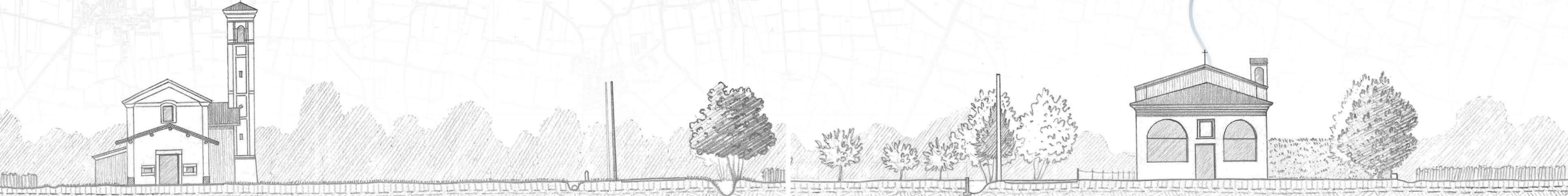
SEZIONE AA' - Percorso nelle vicinanze della Chiesa della Madonna della Formica SCALA 1:200