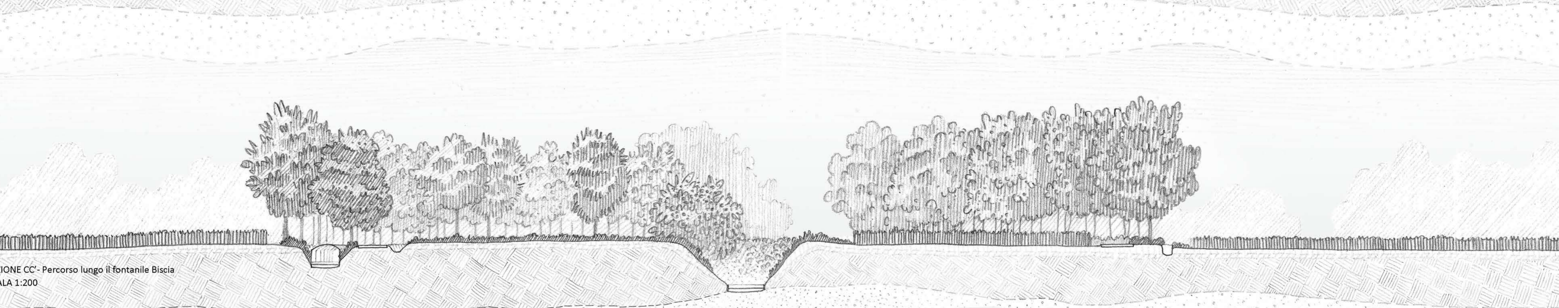
SEZIONE CC' - Percorso lungo il fontanile Biscia SCALA 1:200