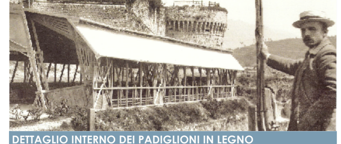
DETTAGLIO INTERNO DEI PADIGLIONI IN LEGNO