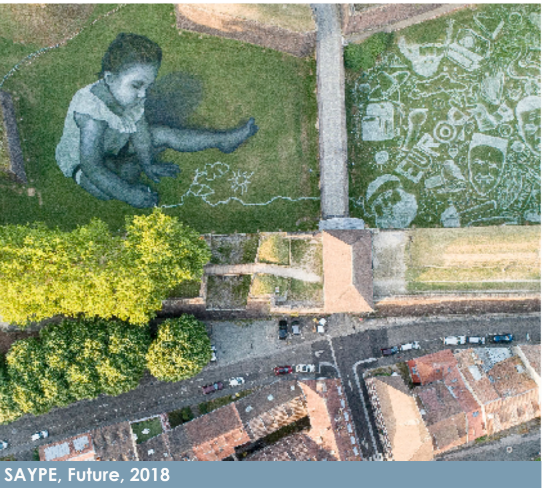
SAYPE, Future, 2018