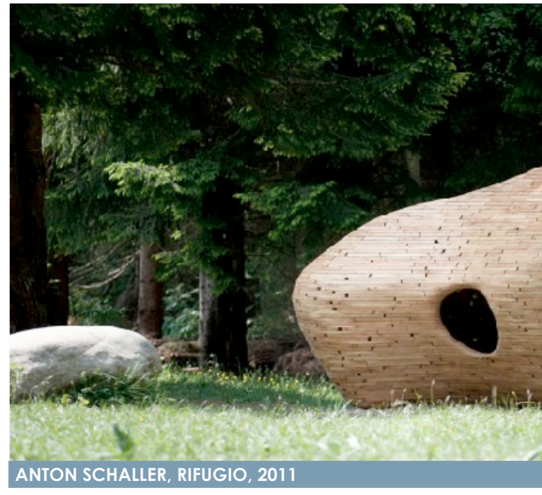
ANTON SCHALLER, RIFUGIO, 2011