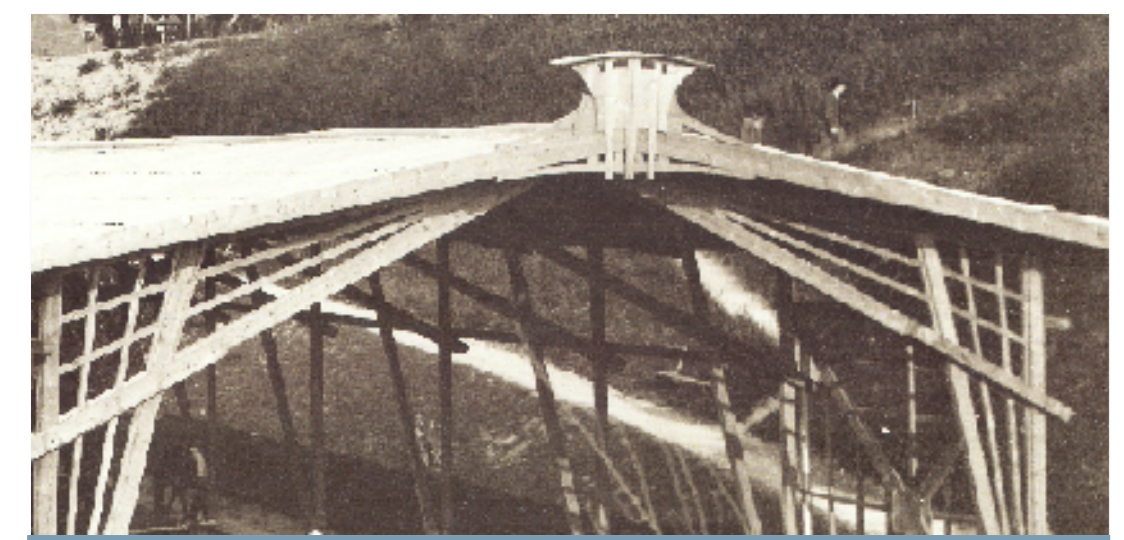
DETTAGLIO ESTERNO DEI PADIGLIONI IN LEGNO