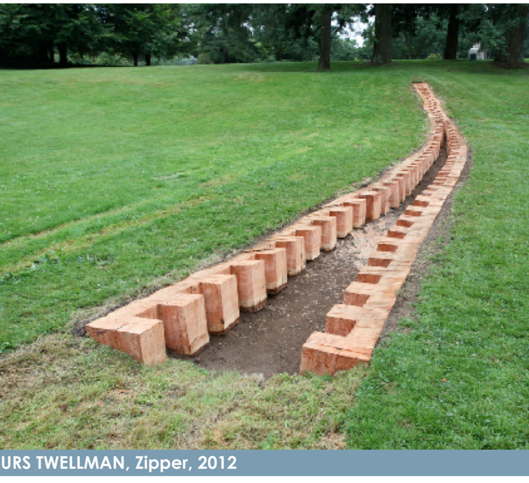
URS TWELLMAN, Zipper, 2012