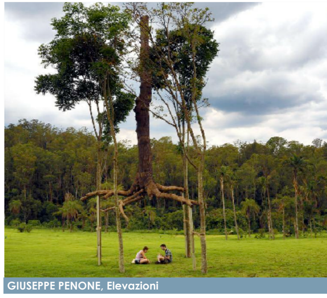
GIUSEPPE PENONE, Elevazioni