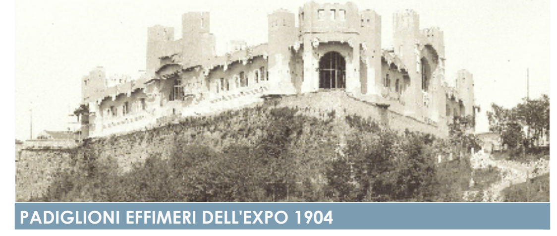
PADIGLIONI EFFIMERI DELL'EXPO 1904