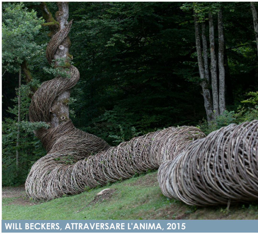
WILL BECKERS, ATTRAVERSARE L'ANIMA, 2015