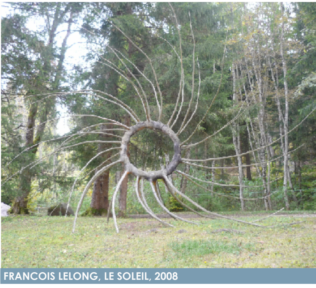
FRANCOIS LELONG, LE SOLEIL, 2008