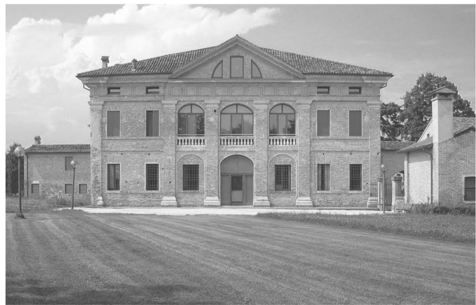
_ Foto stato attuale

Stato attuale: Sede degli uffici comunali, dal 1996 è inserita nella lista dei Patrimoni dell'Umanità dell'Unesco. Rispetto agli intenti del progetto originale, solo una piccola porzione del fabbricato è stata costruita. Oggi si trova in un buono stato di conservazione ed è aperta al pubblico per visite culturali.