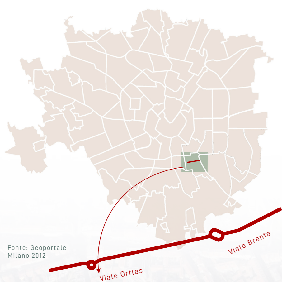
Indicatore 1 di accessibilità ai parchi: la metodologia dei buffer

Popolazione residente all'interno di buffer di 300m dal limite dei parchi con superficie maggiore di 500 m 2 .