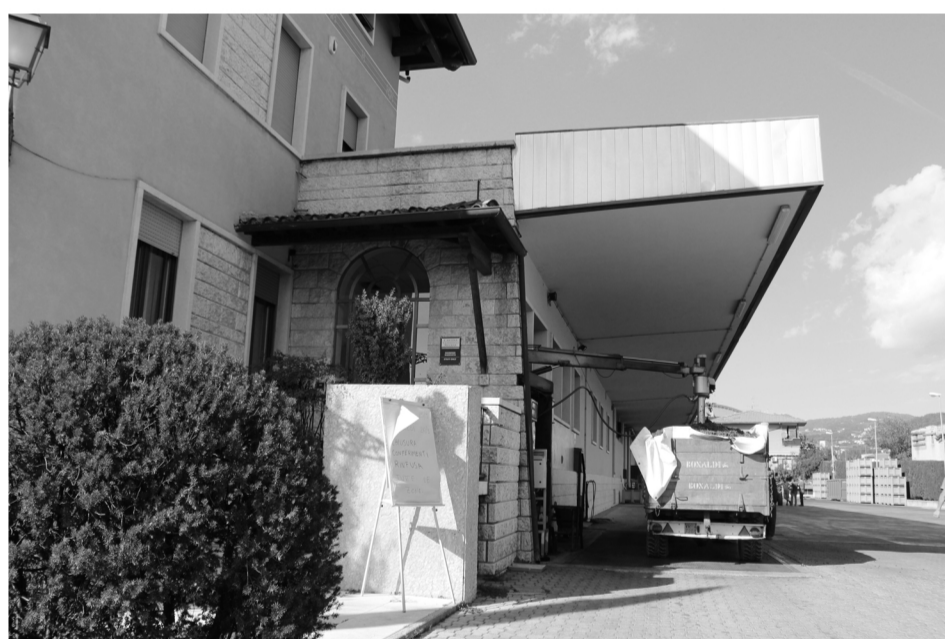
4. Ricevimento uve e analisi tramite braccio meccanico