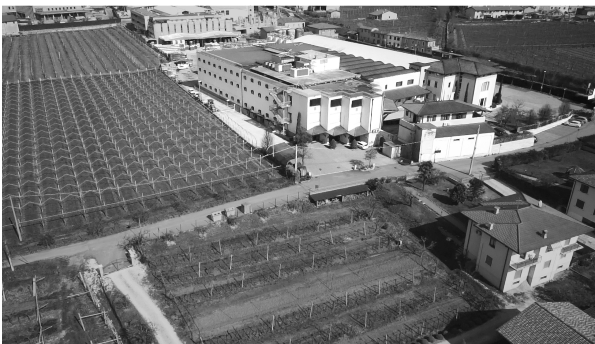
2. Vista aerea della Cantina Valpolicella Negrar