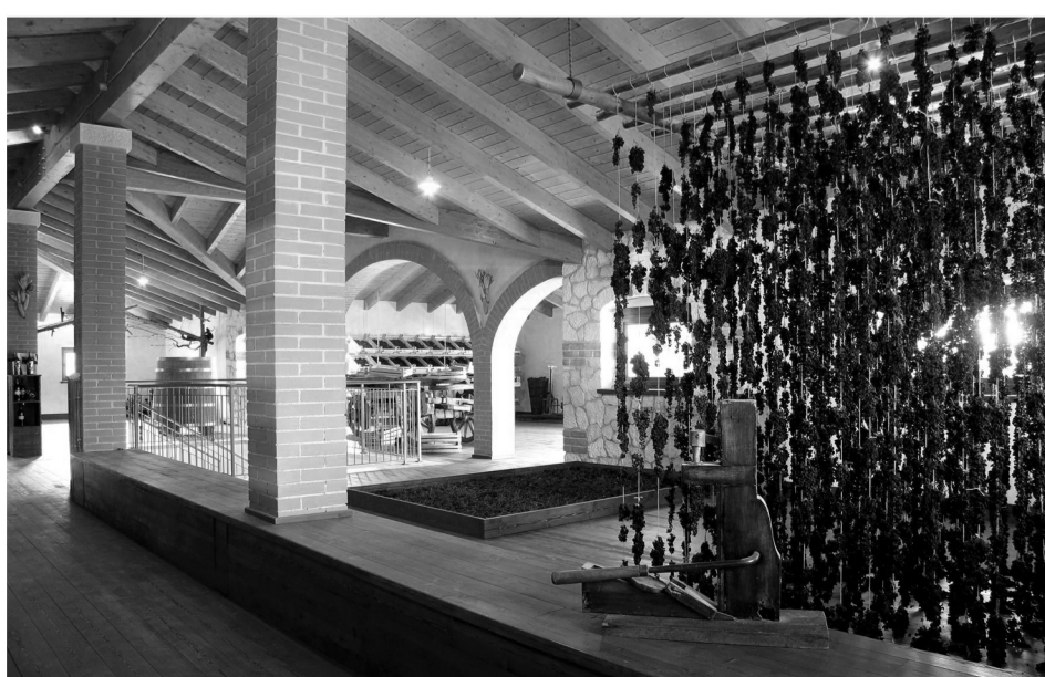
6. Museo del vino con esposizione di tecniche di appassimento antiche