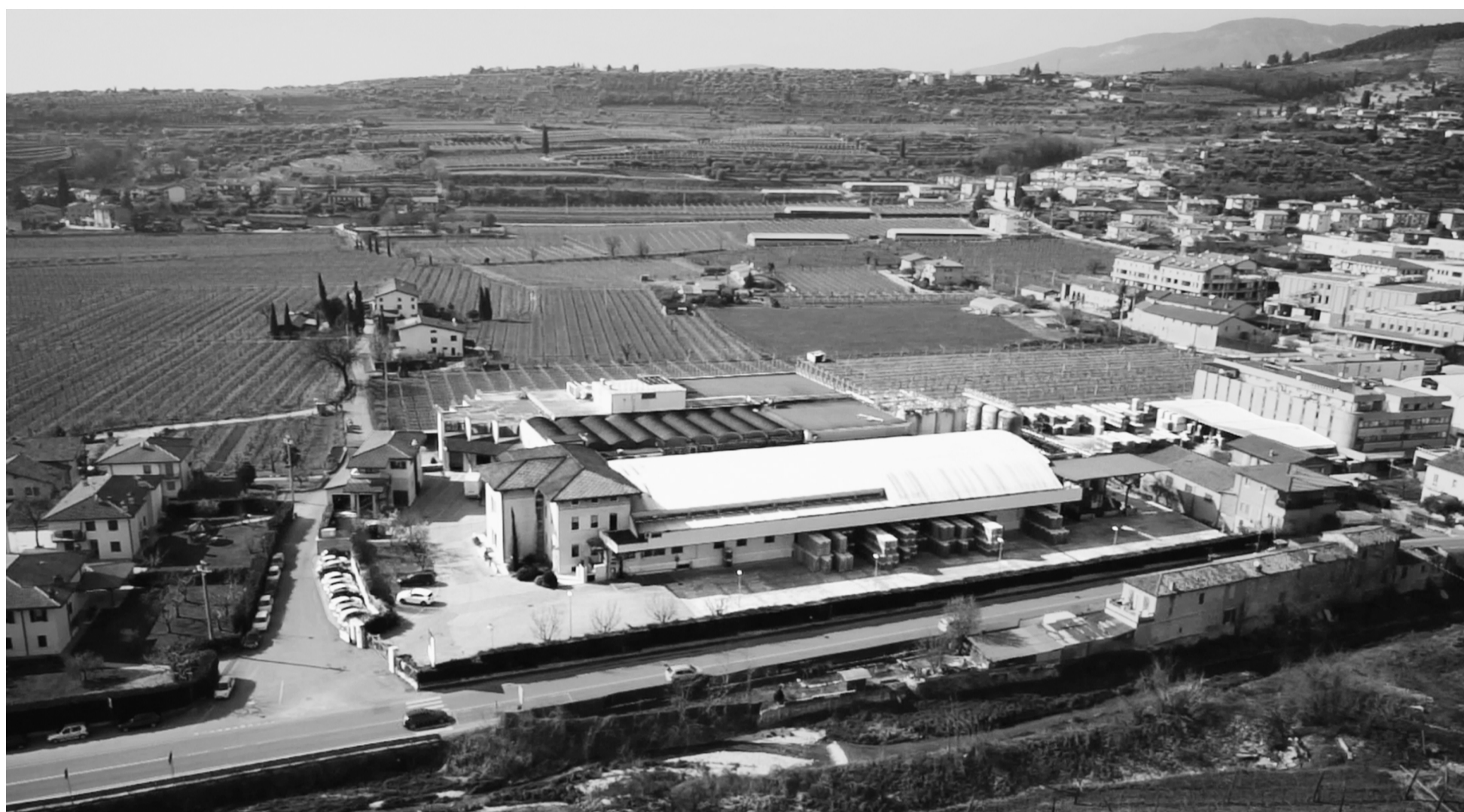
1. Vista aerea della Cantina Valpolicella Negrar