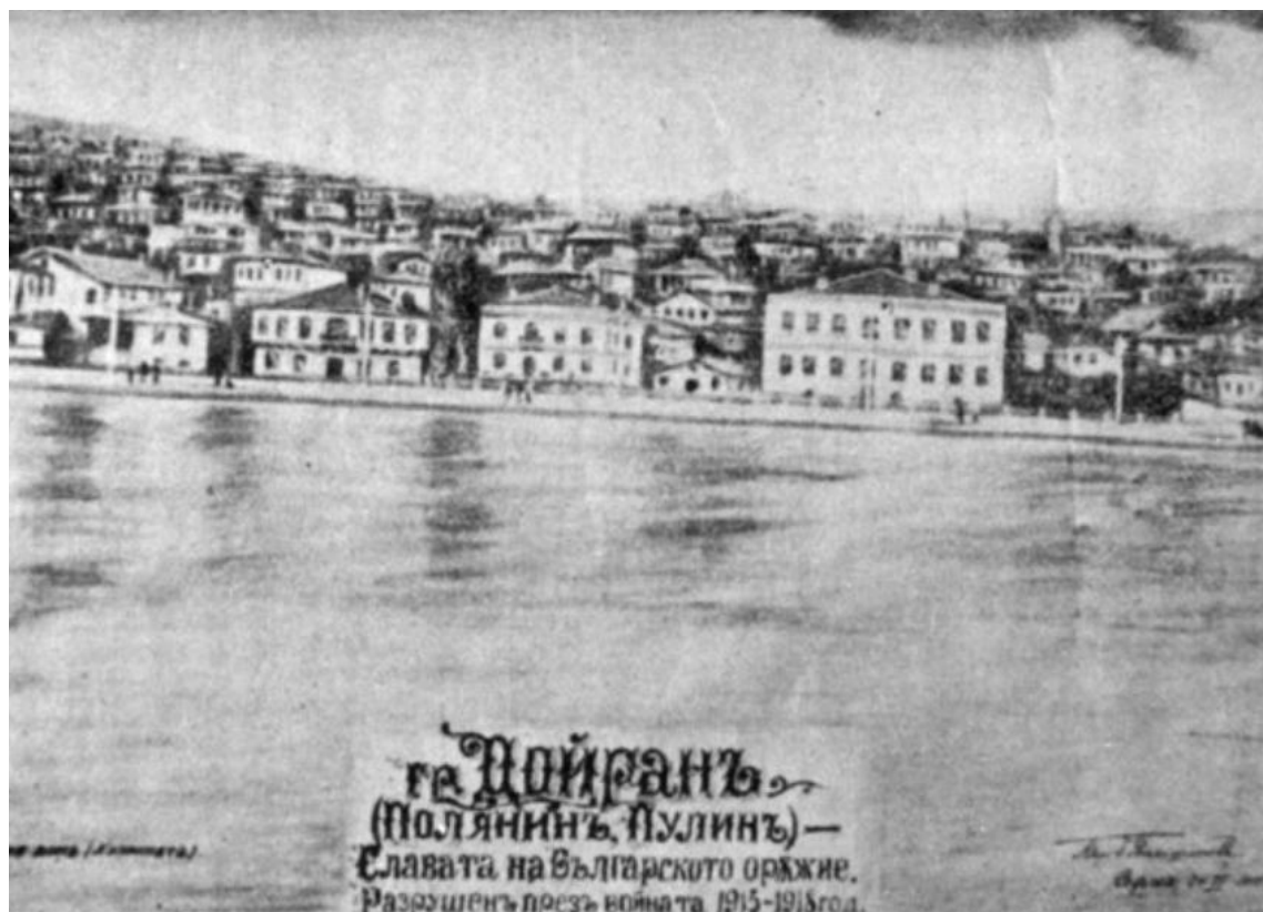
Гр. Дойранъ (Полянинъ, Пулинъ) — Славата на Вългарското оръжие. Разрушенъ презъ войната 1915-1918 год.