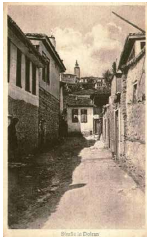
Streße in Dolran

О тешкото! Сега по нашите села во слобода првпат штом оро ќе сретнам, зар чудно е - солза да потече врела, зар чудно е - жалба јас в срце да сетам?! Од вековно ропство, мој народе, идеш но носиш ти в срце дар златен и пој. Пченицата твоја триж плодна ќе биде, И животот твој!